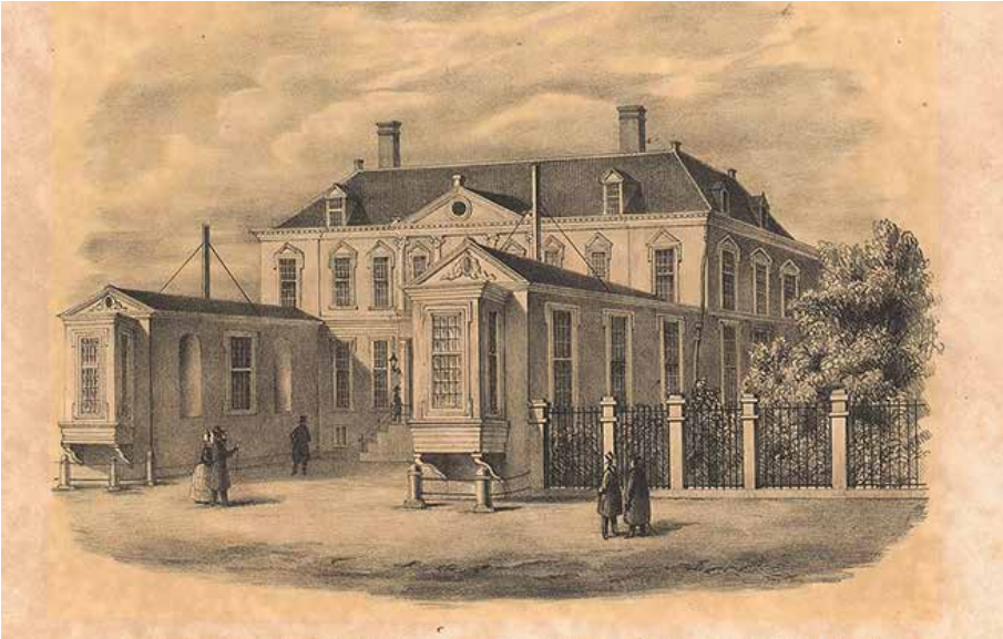
Aanzicht van het Ministerie van Koloniën in het voormalige Huygenshuis in Den Haag.

Ministerie van Koloniën te overtuigen om bij de herziening van het Reglement (1833) het betreffende artikel te schrappen.