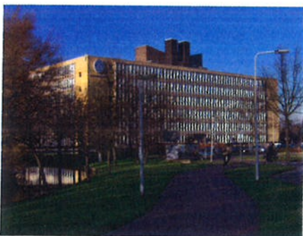
1 Pieter de la Courtgebouw in Leiden, de huidige standplaats van het Afrika-Studiecentrum.

Tips: Reinout Klaarenbeek E-mail: r.klaarenbeek@vu.nl