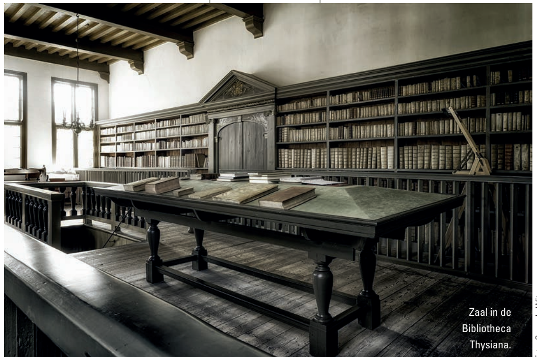
Zaal in de Bibliotheca Thysiana.