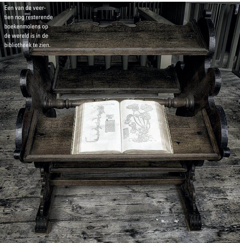
Een van de veertien nog resterende boekenmolens op de wereld is in de bibliotheek te zien.