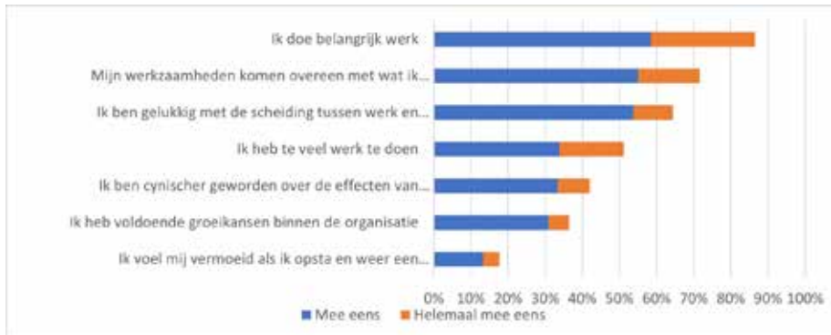
Figuur 2 – Werkbeleving (N=918)

Tot slot hebben we de respondenten een aantal stellingen voorgelegd die betrekking hebben op de werkbeleving. Uit figuur 2 valt een aantal zaken op te maken. De overgrote meerderheid (86%) vindt dat hij/zij belangrijk werk doet. Een kleine driekwart (72%) vindt dat de werkzaamheden overeenkomen met wat hij/zij van de functie verwacht en twee derde (65%) is tevreden met de scheiding tussen werk en privé. De helft van de respondenten (51%) vindt dat hij/zij te veel werk te doen heeft. Vier op de tien (42%) is cynischer geworden over de effecten van zijn/haar werk. Een minderheid, zij het een forse (37%), zegt voldoende groeikansen binnen de organisatie te hebben. Eén op de zes (17%) is vermoeid bij het opstaan als er weer een werkdag voor de boeg ligt.