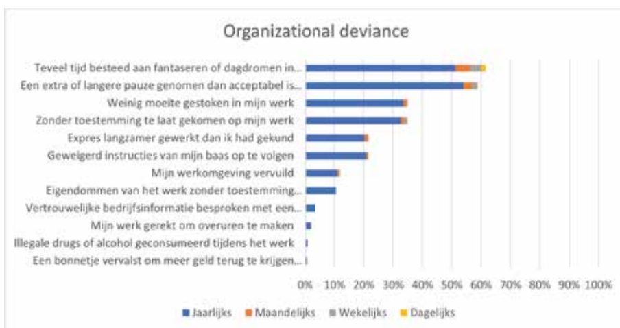
Figuur 4 – In het afgelopen jaar wel eens... (n=918)