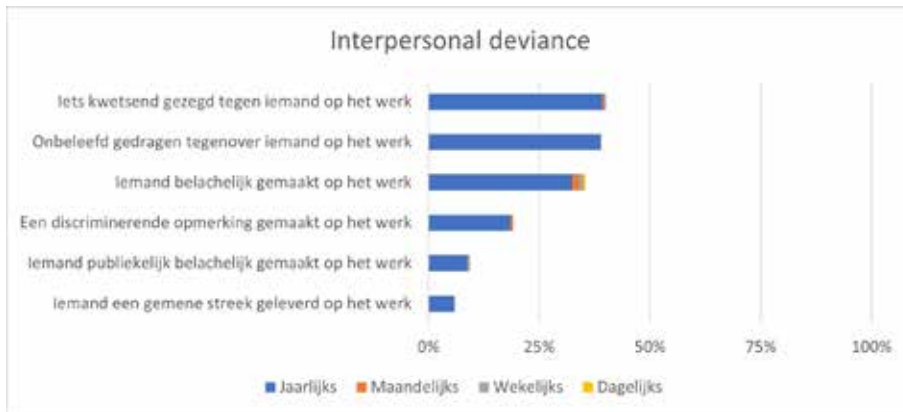
Figuur 3 – In het afgelopen jaar wel eens... (n=918) 27

Bij het contraproductieve gedrag richting de organisatie is te zien dat de meerderheid in het afgelopen jaar te veel tijd heeft besteed aan dagdromen in plaats van werken en langere pauzes heeft genomen dan acceptabel is (zie figuur 4). Andere contraproductieve gedragingen komen minder voor, zij het dat het nog steeds om een behoorlijke minderheid gaat. Zo steekt ruim een derde weinig moeite in het werk of komt zonder toestemming te laat. Opvallend is dat ongeveer 20% aangeeft instructies van de baas te hebben geweigerd en expres langzamer heeft gewerkt dan had gekund. Een zeer beperkt deel scoort op de ernstiger vormen van contraproductief gedrag, zoals het meenemen van eigendommen van de politie en het bespreken van vertrouwelijke informatie met een onbevoegd persoon.