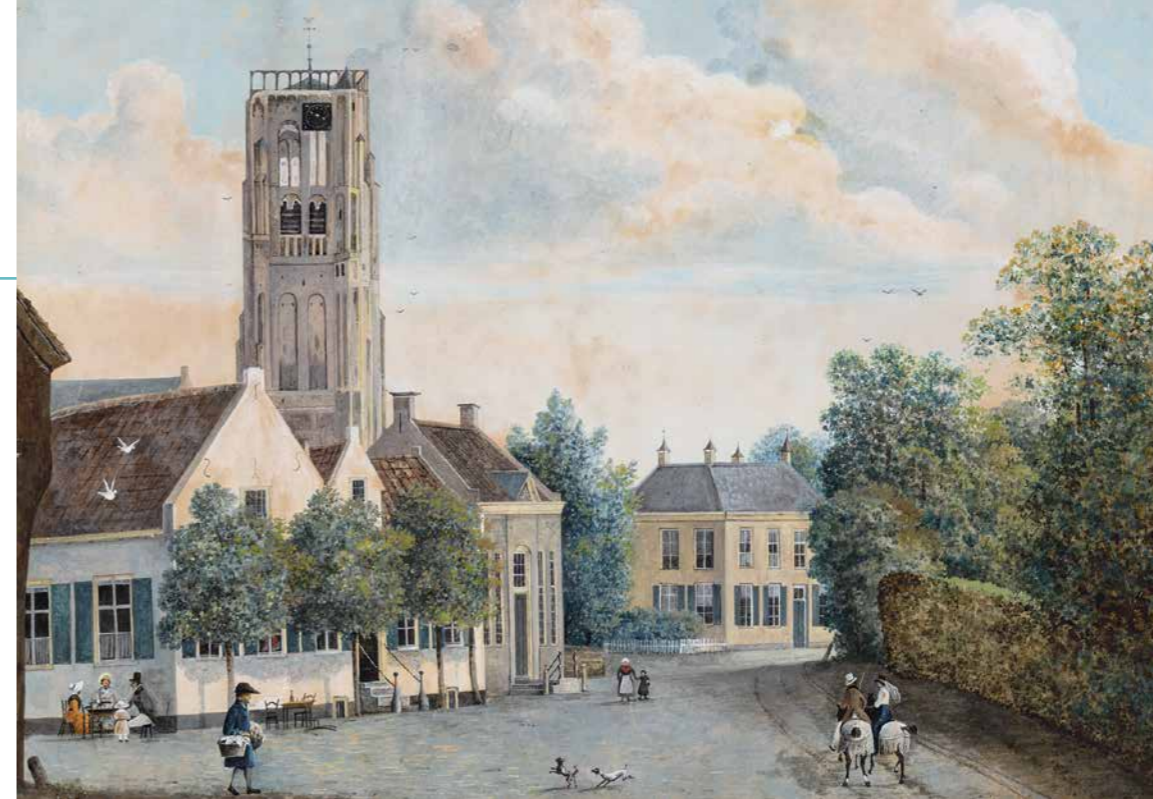
Het gebouw op de hoek, achter de bomen is herberg 't Bijltje in Vught. Josephus Augustus Knip, Gezicht van Vught met Lambertustoren , z.j. (Aquarel op papier, 45 x 35 cm. Foto: Peter Cox. Collectie: Het Noordbrabants Museum, 's-Hertogenbosch)

Behalve het beschermen van bezit hadden de boomschendersborden waarschijnlijk nog een an-