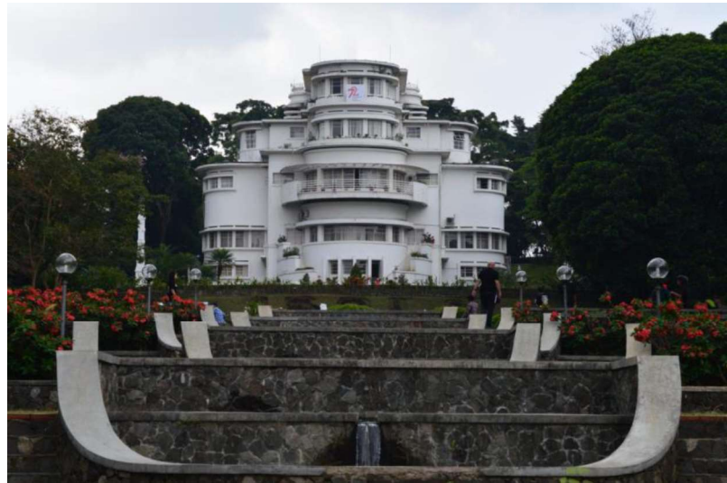
'Bumi Siliwangi' in 2017

Door een vertragende tactiek van Indonesische kant kwam het pas in de loop van 1954 tot een deal. Het brutobedrag van (omgerekend) een half miljoen gulden viel nog wel mee, maar 'de uiteindelijke opbrengst was zeer teleurstellend', aldus Alex Oelrich: aan allerlei mensen dienden hoge 'commissies' te worden betaald en het nettobedrag kwam beschikbaar in roepiahs waar de officiële koers niet op van toepassing was. Bovendien mocht er geen geld uit Indonesië worden uitgevoerd. Uiteindelijk kwam slechts een fractie van die half miljoen gulden bij de erven terecht.