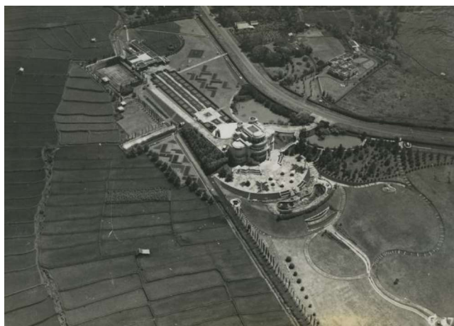
Luchtfoto van 'Villa Isola' en het landgoed