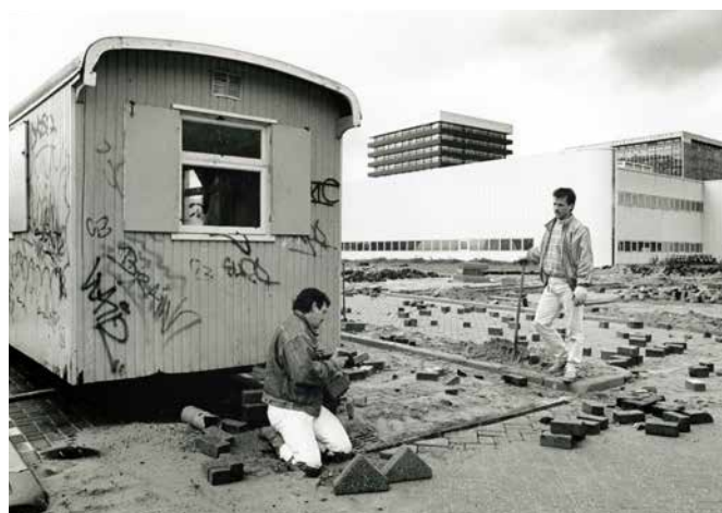
Afb. 1 Uitbreiding van het Academisch Bedrijven Centrum, november 1991.