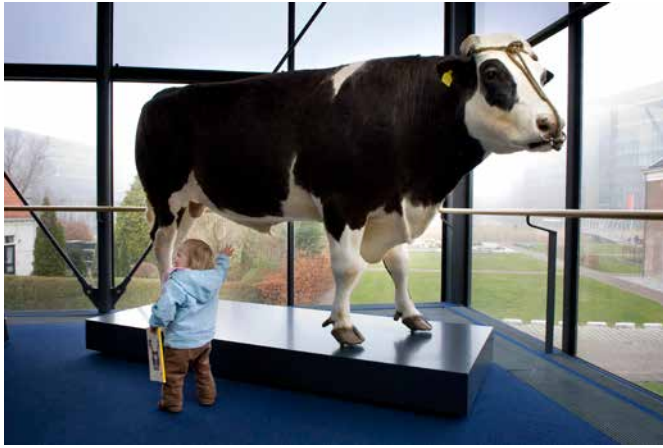
Afb. 4 Stier Herman, na zijn dood in 2006 opgezet en 'bijgezet' in museum Naturalis.

officiële antwoord was 'nee'. De Tweede Kamer legde wettelijke beperkingen op en Herman moest worden gecastreerd. 32