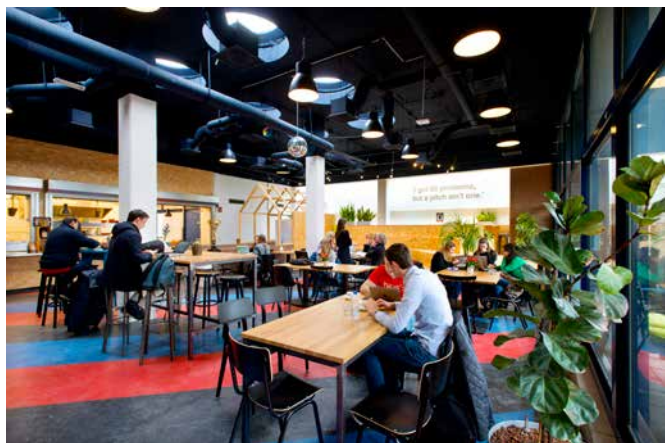
Afb. 8 HUBspot aan de Langegracht, februari 2017.

Om de ontwikkeling van het Bio Science Park verder te steunen heeft LEH de laatste jaren, naast BioPartner, ook geld geleend aan de Biotech Training Facility en aan NecstGen . De eerste biedt een gezamenlijk trainingsprogramma voor mensen die biomedische onderzoeks- en productietechnieken onder de knie willen krijgen. Het maakt het makkelijker voor bedrijven en andere organisaties om geschikt personeel te krijgen. De tweede, The Netherlands Center for the Clinical Advancement of Stem Cell and Gene Therapies , helpt onderzoekers van universiteiten en bedrijven bij stamcelonderzoek om tot effectieve behandelmethode te komen. Ook hier is het devies dat samenwerking het mogelijk maakt om veel betere voorzieningen voor onderzoek en productie te maken. Vanuit haar nieuwe doelstelling, ontwikkeling van het Bio Science Park, helpt LEH ook daarbij. 66