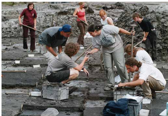
Afb. 3 Archol aan het werk langs de A4 bij Schipluiden, augustus 2003.