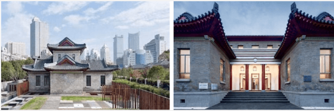
De voormalige Nederlandse ambassade te Nanjing, na restauratie in 2016