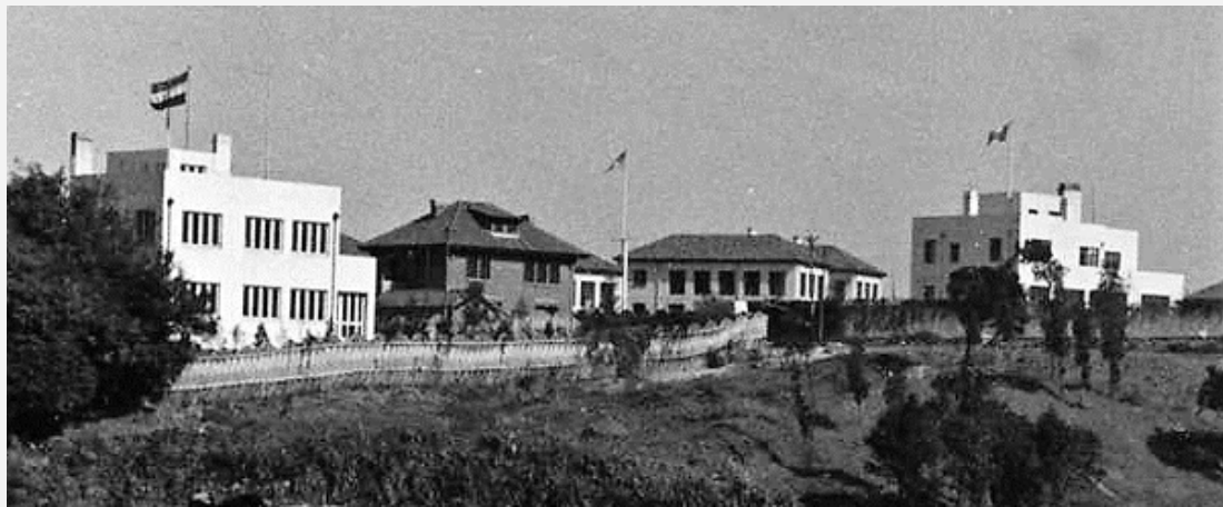
De twee 'Nederlandse' huizen in Nanjing, omstreeks 1946. Rechts de (latere) ambtswoning van Aerssen.

was wel duidelijk dat de hotelmanager niet heel trots was op de rommel en verwaarlozing die ik er aantrof.