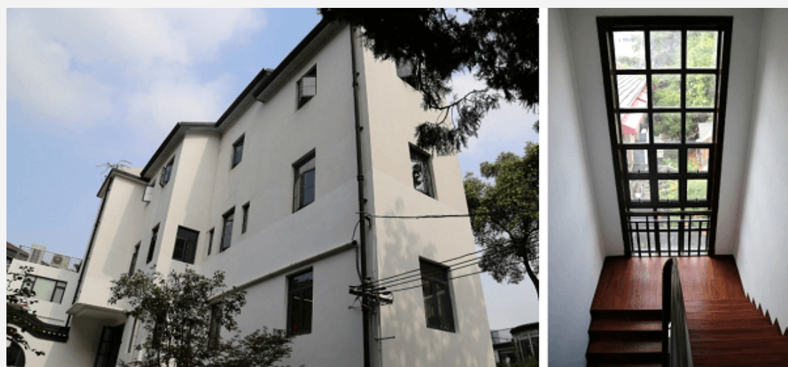
Het huis (met de extra verdieping) en de trap van Marnix anno 2021