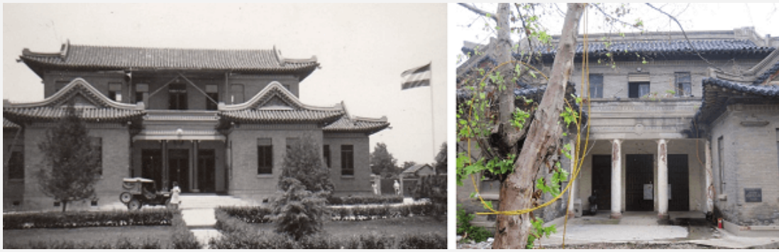
De voormalige Nederlandse ambassade te Nanjing, in 1949 en in 2011