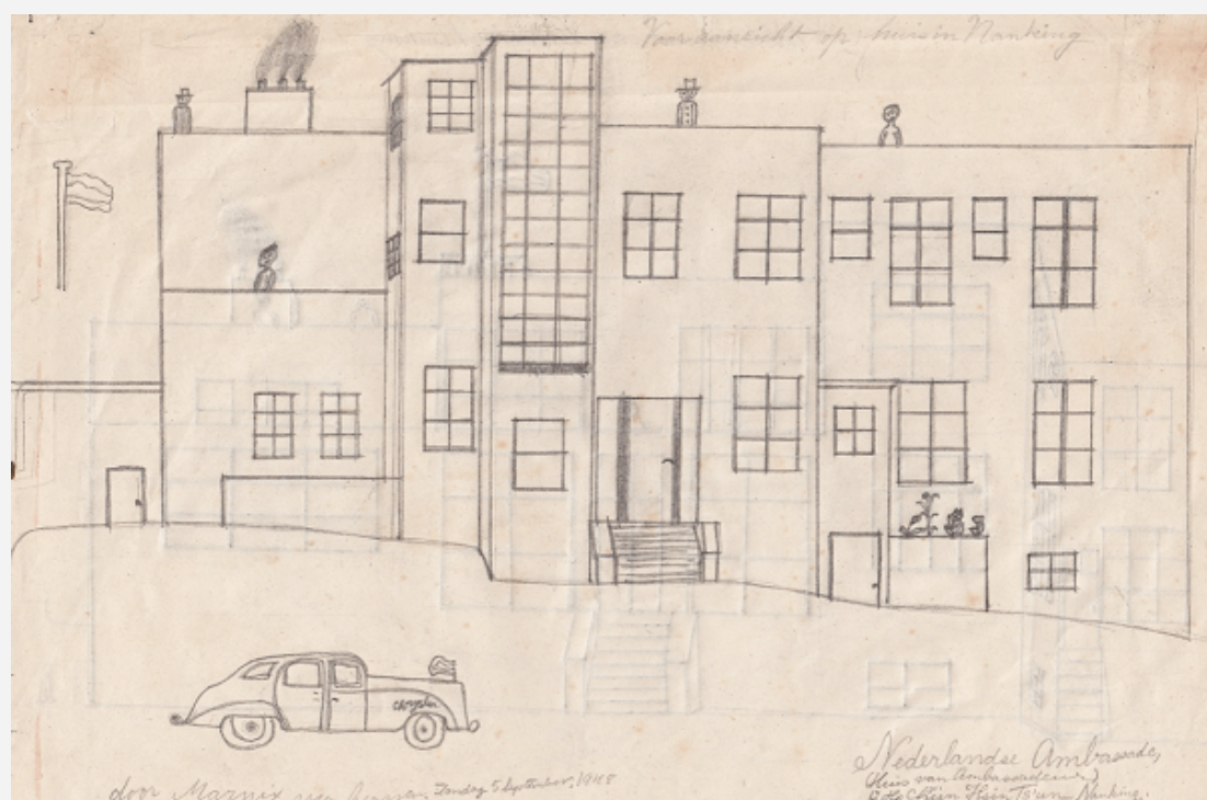
Residentie van de Van Aerssens, getekend door de 11-jarige Marnix, 5 september 1948