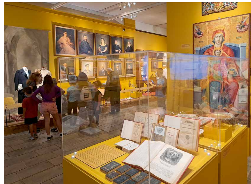
Veel jeugdige bezoekers

komt de bezoeker nu in een veel donkerder ruimte, tegen een blauwgrijs decor. De ogen hebben een paar seconden nodig om zich aan te passen. Men voelt: de bloeiperiode is voorbij, onheil hangt in de lucht maar de vernietigende kracht van de geschiedenis kan nog niet precies overzien worden.