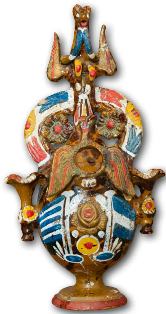
Typische kruik uit Kioutáchia met paardenhoofd en Griekse vlaggen

De impact van het vluchten wordt treffend getoond tegen een decor van tenten