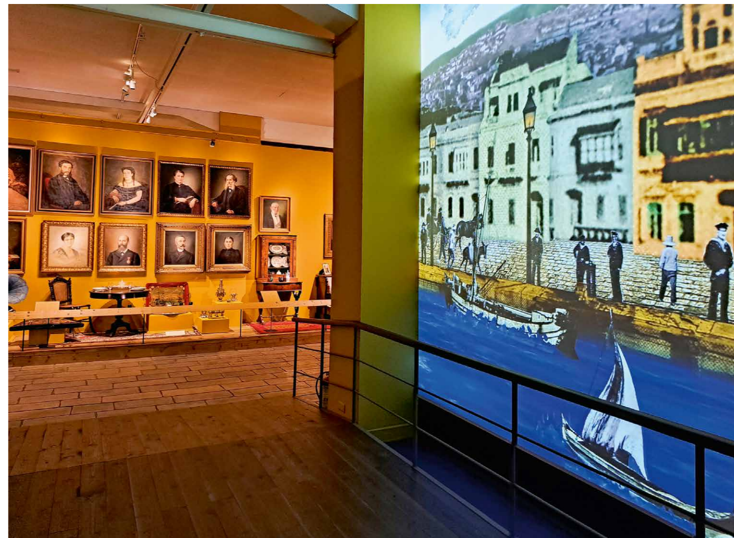
Entree tot de tentoonstelling

de kusten en in de binnenlanden van Anatolië), gevolgd door de veranderingen in de periode 1908-1922 en het leven van de vluchtelingen in Griekenland na hun exodus. Onder begeleiding van scheepsgeluiden 'meert' de bezoeker vervolgens aan op de befaamde kade van Smyrna, in animatievorm geprojecteerd op een metershoge videowand. Enkele stappen verder betreden we de daadwerkelijke tentoonstelling.