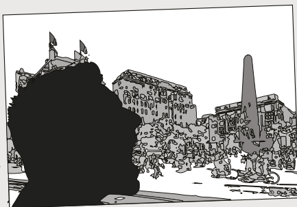
De damschreuder - 2010

“Gemiddeld krijgt de politie 365 telefoontjes per dag over verwarden”