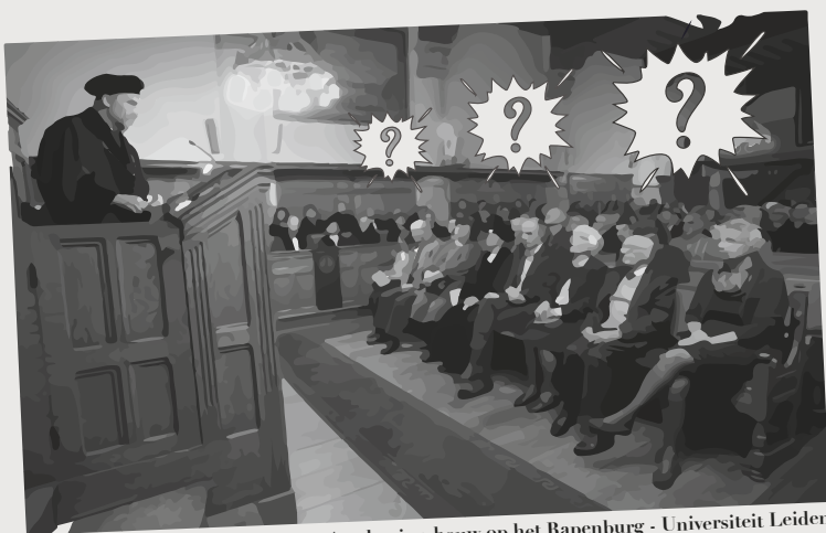
Academiegebouw op het Rapenburg - Universiteit Leiden