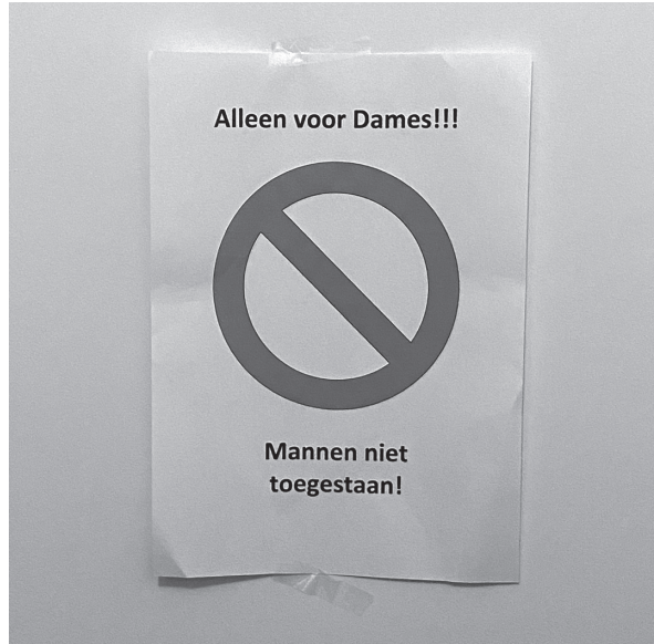
Waarschuwbordje in een women-only gym.

De mainstream Nederlandse liberale samenleving gaat uit van een dichotomie tussen seculier/modern enerzijds en religieus/'achterblijvend' anderzijds, met een impliciete superioriteit van christendom en wijsheid. 5 Dit is goed zichtbaar in sportbeoefening, bijvoorbeeld als we kijken naar discussies over voetballers die vasten tijdens de ramadan, of discussies over gescheiden sporten