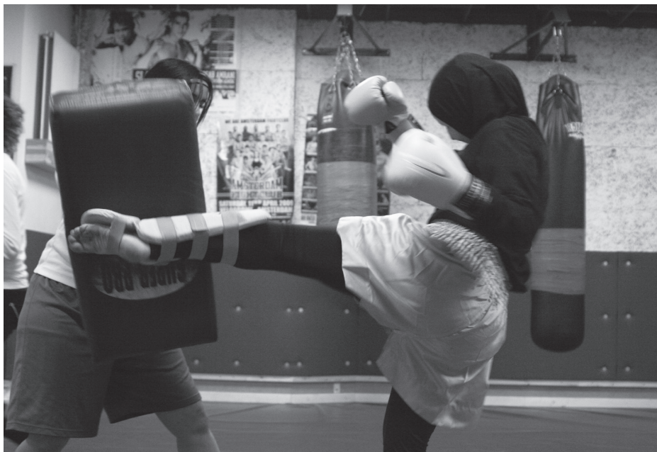
Deze kickbokser koos voor een roze broek en roze handschoenen en scheenbeschermers.

vrouwen en het feit dat in sommige wijken de meeste deelnemers, inclusief de trainers, moslim zijn, laten aspirant-leden zien hoe kickboksen gemakkelijker dan andere sporten kan worden omgevormd tot een geschikte recreatieve sport.