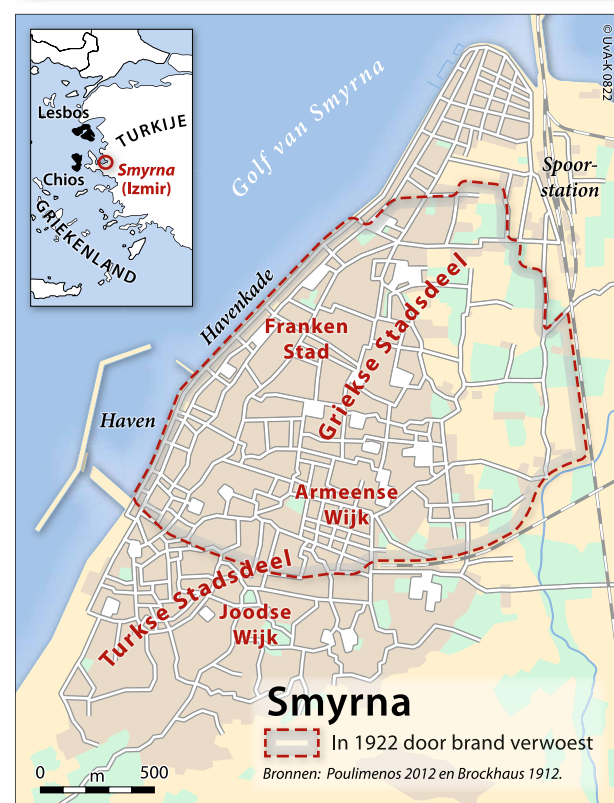
Stadsplattegrond met de diverse stadsdelen en omvang van de verwoesting