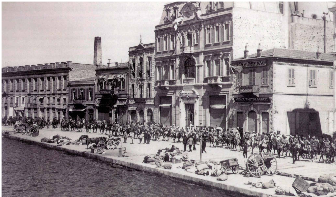
Aankomst van de Turkse cavalerie op de kade van Smyrna, 9 september 1922

oorlogsschepen in de baai versterkte die gedachte bij aankomst. Maar waar de soldaten en uiteindelijk ook het Griekse bestuur uit Klein-Azië werden geëvacueerd, kwamen de vluchtelingen met hun schamele bezittingen terecht op de havenkade, volgens ooggetuigen tussen de immer nog flaneerende inwoners.