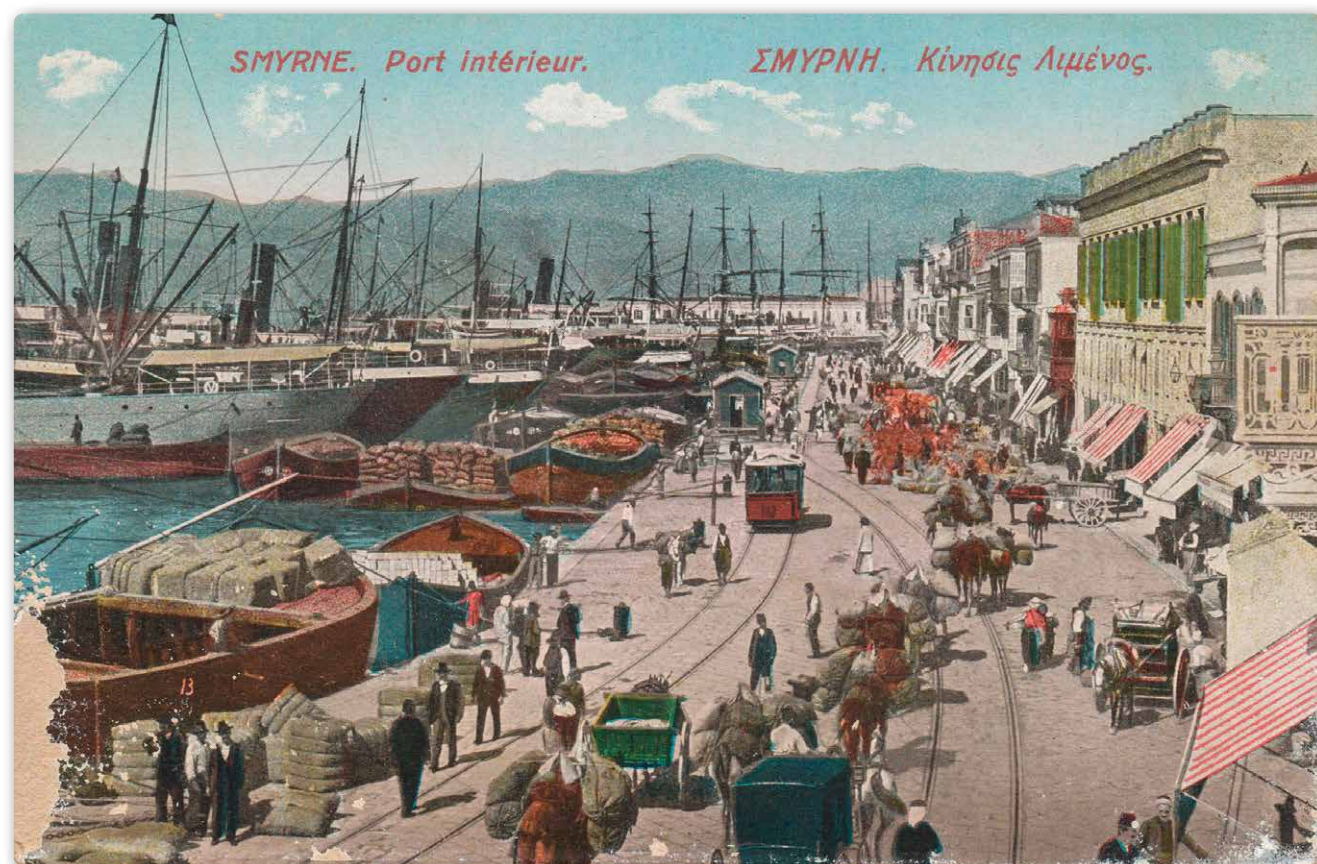
Ansichtkaart van de levendige handelskade, begin 20 e eeuw