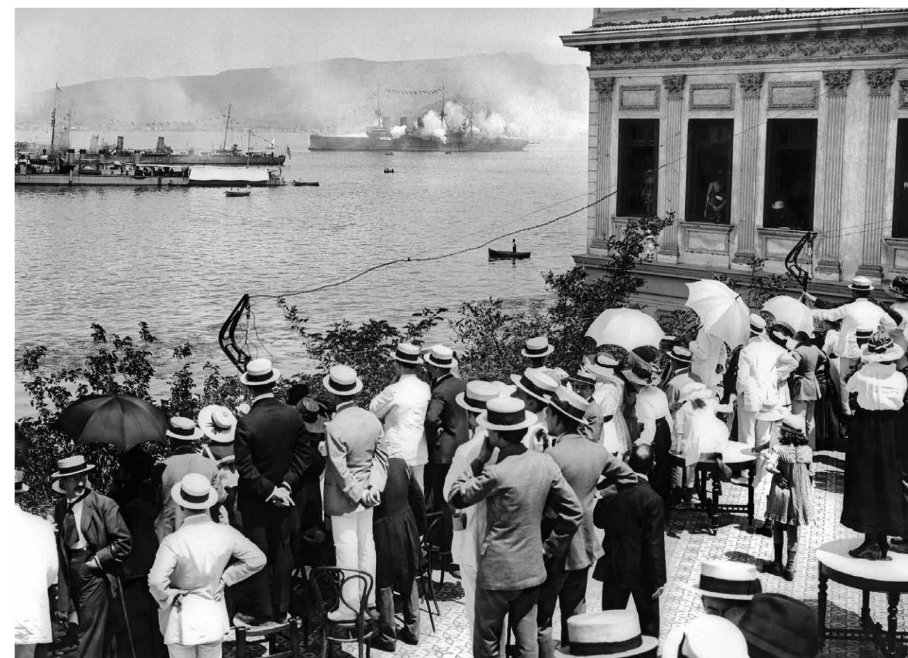
Aankomst van het Griekse leger op 15 mei 1919, gadeslagen door de leden van de Sporting Club aan de havenkade

En dus landde het Griekse leger op 15 mei 1919 in Smyrna, tot grote vreugde van de orthodoxe inwoners die massaal waren uitgelopen om hun 'bevrijders' te onthalen. Maar nog