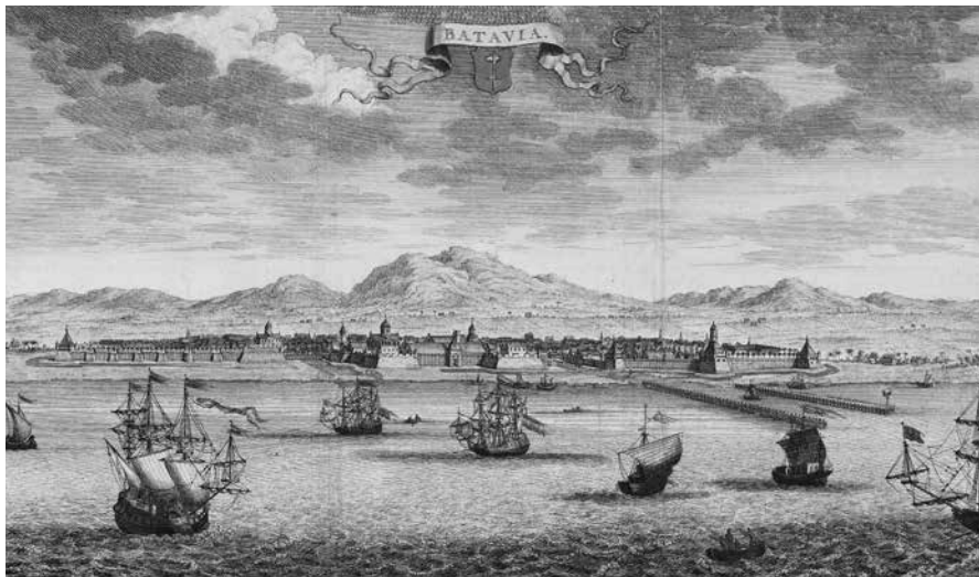
Batavia, door Jacob Keyser 1730.

uitgegeven. Met zijn landschapsbeschrijvingen, vertellingen over bloedstollende avonturen, kleurrijke ontmoetingen en ontroerende (liefdes)geschiedenissen wist Haafner zijn lezers te boeien, al plaatste een deel van hen wel vraagtekens bij de authenticiteit van zijn verhalen. In zijn werk benadrukt Haafner meermalen het waarheidsgehalte van zijn verhalen. 4 Ook zijn zoon merkte na Haafners dood op dat deze als ooggetuige van de ‘Oostindiën’ een getrouw beeld schetste. 5 Net als alle reisliteratuur bevat zijn werk echter ook fictieve elementen. Dat begint al met Haafners geboortjaar: zelf noemt hij 1755, maar uit onderzoek is gebleken dat hij een jaar eerder het levenslicht zag. Wilde hij verdoezelen dat hij al zeven maanden na het huwelijk van zijn ouders ter wereld kwam en dat hun verbintenis dus een ‘moetje’ was? 6