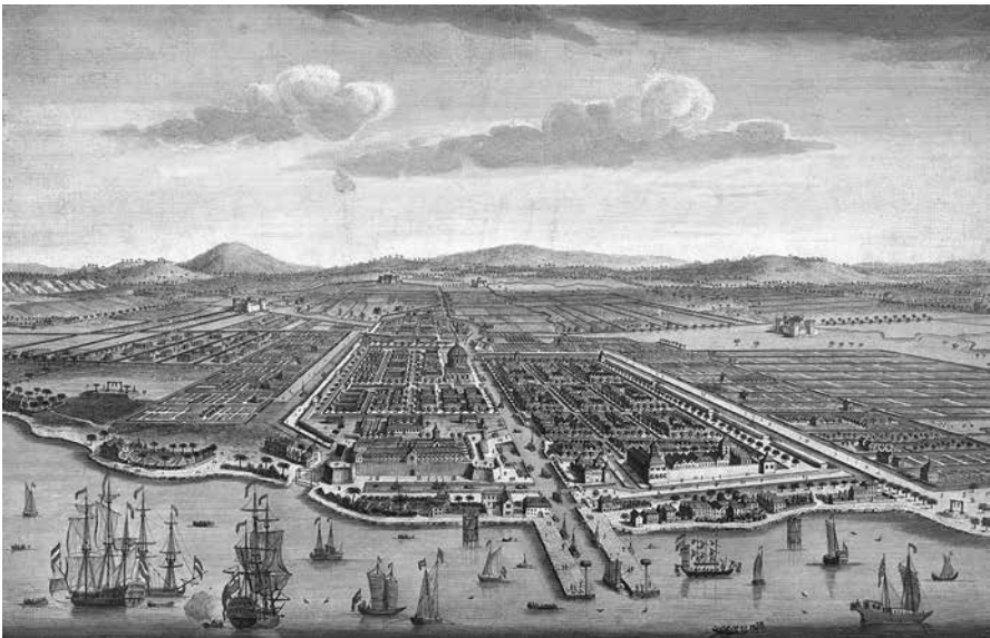
Gezicht op de stad Batavia, naar een tekening van I. van Ryne, 1754.

Dit moge doorgaan op de Afrikaansche kust, bij de negers, Hottentotten en Kaffers; doch waar is iemand, die niet weet, wat Aziatische pracht is, en dus niet beseft, dat al onze praal steeds maar eene flauwe naäping van die hunner inlandsche vorsten blijft; ook geven zij er weinig acht op, en denken er mogelijk niet eens aan, dat al deze belagchelijke vertooningen der Compagniesdienaren de magt en rijkdom van de Hollandsche natie moeten kenmerken; de vreemdelingen spotten er insgelijks mede, en het is alleen aan het voldoen van den buitensporigen hoogmoed der gindsche beambten, dat men dit ongegrond voorwendsel en de instandhouding dier gebruiken te danken heeft. 30