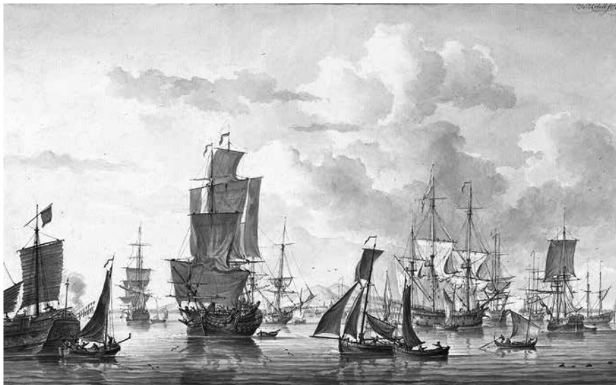
Gezicht op de rede van Batavia, door Hendrik Kobell, 1778. Collectie Rijksmuseum, Amsterdam.

ze hem ervan dat hij het met hun dochtertje aanlegde. Daarop kreeg Haafner zijn ontslag en werd hij teruggestuurd naar de Kaapkolonie. 18