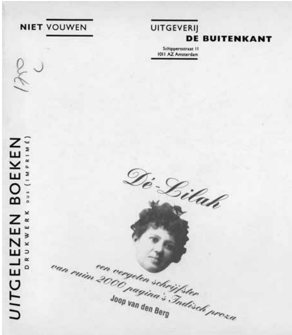
Publicatie Joop van den Berg. Particuliere collectie.