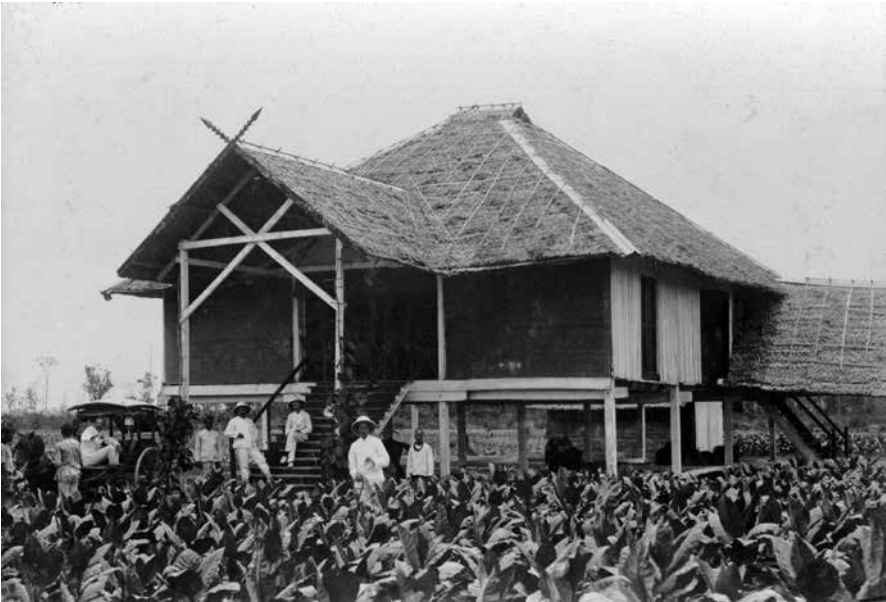
Huis van een assistent op tabaksonderneming Tandem, vermoedelijk in Langkat, circa 1905.