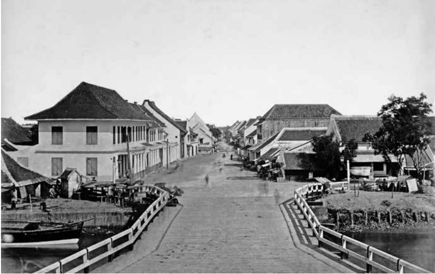
Roode Brug te Soerabaja, vóór 1880.