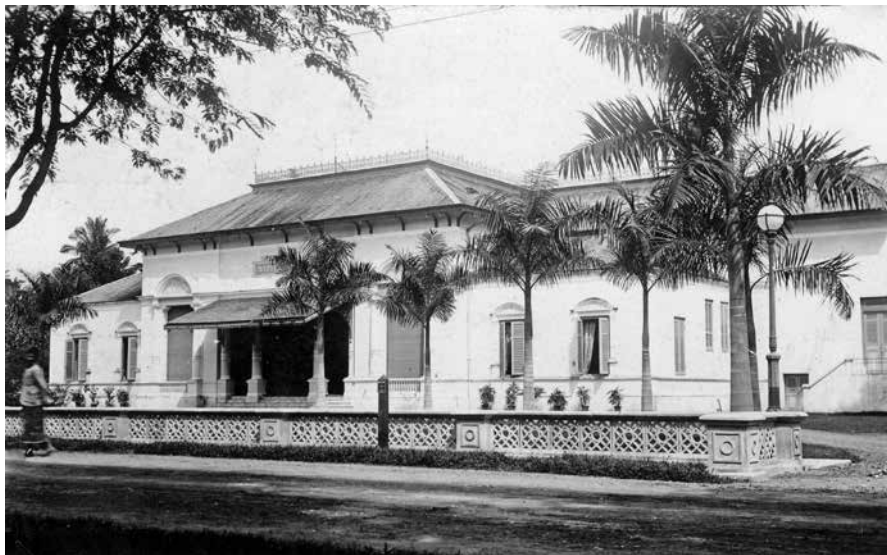
De Witte Sociëteit te Medan, circa 1905.