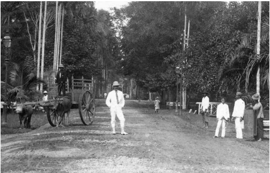
Serdangweg Medan. Particuliere collectie.