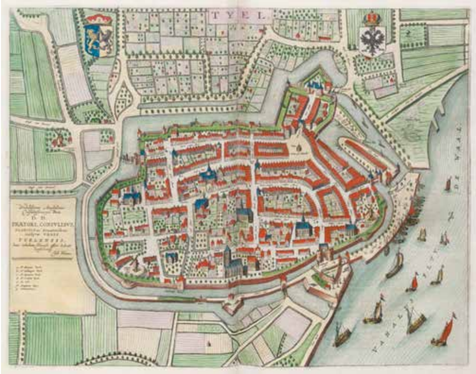
Kaart 5.2 Kaart van Tiel omstreeks 1650 uit de atlas van Blaeu. De Maartenskerk staat onderaan (zuiden), de Walburgkerk en links daarvan de commanderij staan langs de westelijke stadswal. Aan de overzijde van de singel is de commandeursmolen te vinden. J. Blaeu, Toonneel der steden van de Vereenighde Nederlanden II: Steden van Gelderland en Zutphen (Amsterdam 1652) 68; De hier getoonde kaart is afkomstig uit de collectie van de Universiteit Utrecht (Utrecht UB: MAG: AC 72).

kwamen de meeste aangekochte goederen toe aan het huis te Tiel. De belangrijkste aanwinst voor de commanderij Tiel was de naast het ordelhuis gelegen Walburgkerk. Daar konden de broeders hun geestelijk leven manifesteren en hadden zij alle gewijde ruimte om een religieuze band met de lokale burgerij op te bouwen. Dat kan een rol hebben gespeeld bij de lange reeks schenkingen aan de commanderij tot ver in de vijftiende eeuw. Er zijn tientallen veelal kleine transacties ten behoeve van de broeders bewaard gebleven. 177 Volgens de schatting van Van Bavel groeide het landbezit van ongeveer 125 morgen van de commanderij Ophemert rond 1300 naar 275 morgen aan de vooravond van de Reformatie. 178 Tiel was hierdoor zonder twijfel de grootste commanderij van de balije na het hoofdhuis in Utrecht. In 1396 verbleven er vijf broeders met het kruis, waarvan drie priesters. Ook waren er een halfzuster, vijf knechten en twee huishoudsters aan de com-