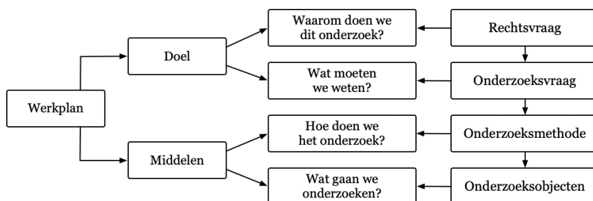
Figuur 2 Het maken van een werkplan

Het kan ook prospectief: door na te denken hoe je eigenlijk zo'n zaak behoort aan te pakken met het opstellen van een beproefd werkplan: het methodisch toepassen van de juiste kennis, technologie en ervaring. Dat betekent het formuleren van het doel van het onderzoek en dat conceptuele ontwerp is de probleemstelling . Wat er onderzocht zal gaan worden, gebeurt aan de hand van de vraagstelling . We zien de noodzaak van het stellen van open vragen. 41 Om op die vragen antwoord te kunnen geven, wordt vervolgens de onderzoeksmethode geëxpliciteerd en aangegeven welke objecten daarmee zullen worden onderzocht (zie figuur 2).