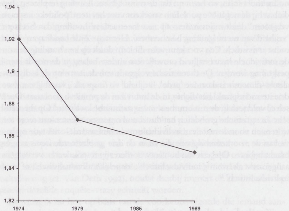
Figuur 1: Mate van individualisme in waarde-oriëntaties van de Nederlandse bevolking 1974 - 1989

Hoe heeft zich nu de gemiddelde mate van individualisme in de waarde-oriëntaties van de Nederlandse bevolking tussen 1974 en 1989 ontwikkeld? In figuur 1 is de gemiddelde mate van individualisme afgezet tegen de tijd.