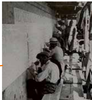
de tekst van de Res Gestae wordt op de muur aangebracht

kopie van de Res Gestae was de kers op de taart. De boodschap was niet te missen: de tekst diende als legitimatie voor Mussolini's alleenheerschappij en zijn overzeese imperialisme. Mussolini's Italië moest het Augusteïsche Rome laten herleven.