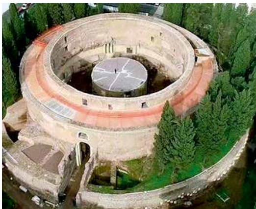
Mausoleo di Augusto na renovatie

Al vroeg op zijn weg naar de alleenheerschappij liet Augustus in Rome een enorme graftombe voor zichzelf bouwen: het 'Mausoleum', op de Campus Martius, aan de Via Flaminia. Al in 28 v.Chr. was het monument vol- tooid. Het Mausoleum zou onderdeel worden van een groter complex van Augusteïsche monumenten in de buurt.