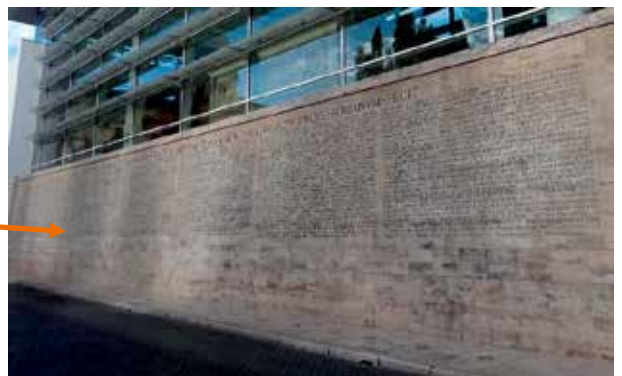
in de buitenmuur is de kopie van de Res Gestae opgenomen