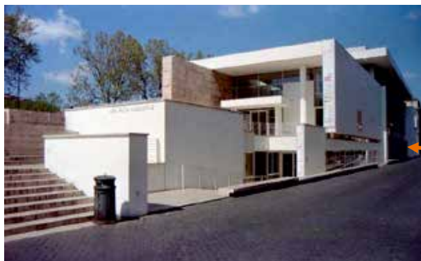
Museo dell' Ara Pacis van Richard Meier

Het oude paviljoen van de Ara Pacis is in 2006 vervangen door een modern museum, ontworpen door Richard Meier (1934). Het bouwproject was zeer controversieel. Maar interessant genoeg richtte de discussie zich op het compromisloze modernisme van het gebouw, dat sterk contrasteerde met de overige gebouwen in het historische centrum, en niet op het feit dat Meier de inscriptie uit het oude paviljoen overnam en incorporeerde in het nieuwe gebouw. Daar staat de tekst nu, netjes ingepast, als museaal object uit een ver verleden.