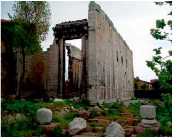
Tempel van Roma en Augustus in Ankara (Ancyra) dit is de zijmuur waarop de Griekse tekst van de Res Gestae stond

Tot slot werd over de hele lengte van de zijkant van de tempel een Griekse vertaling van de Res Gestae aangebracht. Dat die vertaling werd gemaakt, valt makkelijk te begrijpen. Grieks was de bestuurstaal in het oostelijke deel van het rijk, en zelfs onder de Griekse elite was de kennis van het Latijn gering. Door de Res Gestae in het Grieks te vertalen, liet men zien dat de tekst ook voor de Griekse provinciebewoners relevant was.