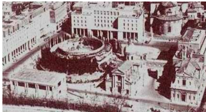
plein met het Mausoleo di Augusto [links midden] en het paviljoen van de Ara Pacis [links onder] anno 1937

De herontdekte inscriptie zou in de twintigste eeuw een nieuw leven krijgen, toen er een kopie in Rome in de buurt van het Mausoleum werd opgesteld. De aanleiding vormde de opgraving van de Ara Pacis , het 'Altaar van de Vrede', dat in 9 v.Chr. was gewijd om de veilige terugkeer van Augustus uit een reeks van oorlogen te vieren. Het altaar werd in de jaren dertig met groot technisch vernuft boven de grond gehaald en tentoongesteld in een nieuw paviljoen naast het Mausoleum. In de plint van dat paviljoen werd in 1938 een kopie van de Res Gestae geplaatst. Voor het eerst waren na twee millennia weer drie belangrijke Augusteïsche monumenten verenigd: de Ara Pacis , de Res Gestae en het Mausoleum.