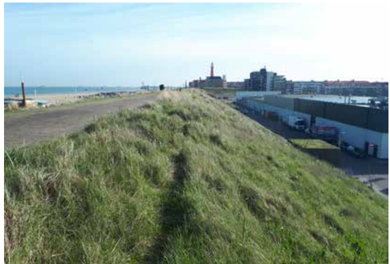
Figuur 1. Het bewuste duintje (oosttalud) anno 2017, leefgebied voor zowel zandhagedis als westelijke smaragdhagedis.

Opvallend genoeg zijn in 2016 ook twee smaragdhagedissen in de Marcellisstraat gevonden op circa 750 meter van het bewuste duintje (A. Denkinger, pers med.; geverifieerd door Richard Struijk). In Nederland zijn smaragdhagedissen eerder ook al in de provincies Overijssel, Gelderland en Noord-Holland incidenteel aangetroffen. In deze gevallen ging het om waarnemingen van individuen en was/is er geen sprake van een populatie.