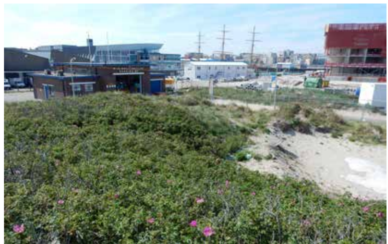
Figuur 2. Hotspot van westelijke smaragdhagedis bij rimpelroos, anno 2000.