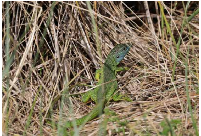
Figuur 4. Man westelijke smaragdhagedis, 2019.

buitenterraria, dus zonder enige vorm van actieve of passieve bijverwarming (Wolterman, 2002; R. Wolterman, pers. med.). Naast het gegeven dat de populatie hier al geruime tijd voorkomt, ondersteunen de genoemde waarnemingen dat er succesvolle voortplanting heeft plaatsgevonden. De kans dat een persoon hier jaarlijks juvenielen uitzet wordt verwaarloosbaar geacht.