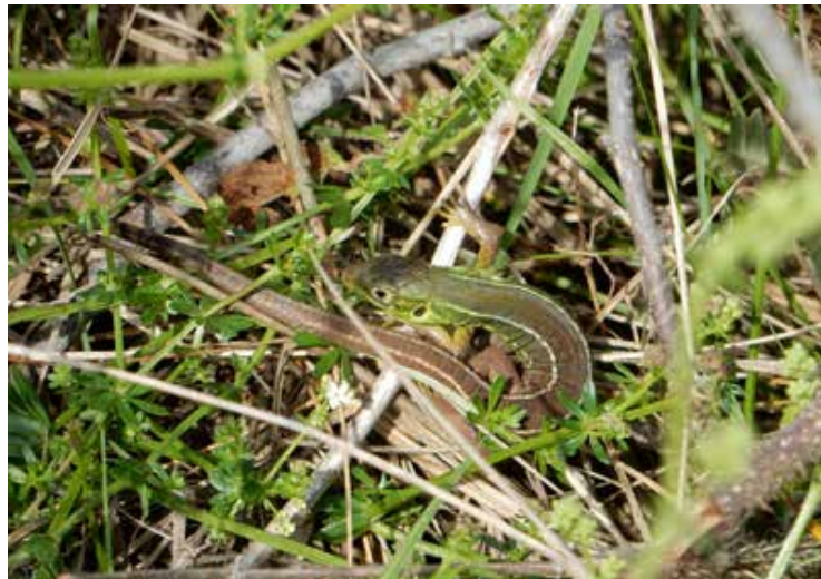
Figuur 6. Subadulte westelijke smaragdhagedis gevonden in april 2020.