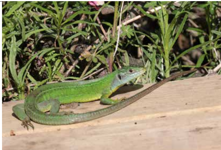
Figuur 5. Vrouw westelijke smaragdhagedis, 2019.

vast ook niet beogen. Bovendien is het wettelijk verboden om – zowel uitheemse als inheemse – dieren uit te zetten in de Nederlandse natuur.