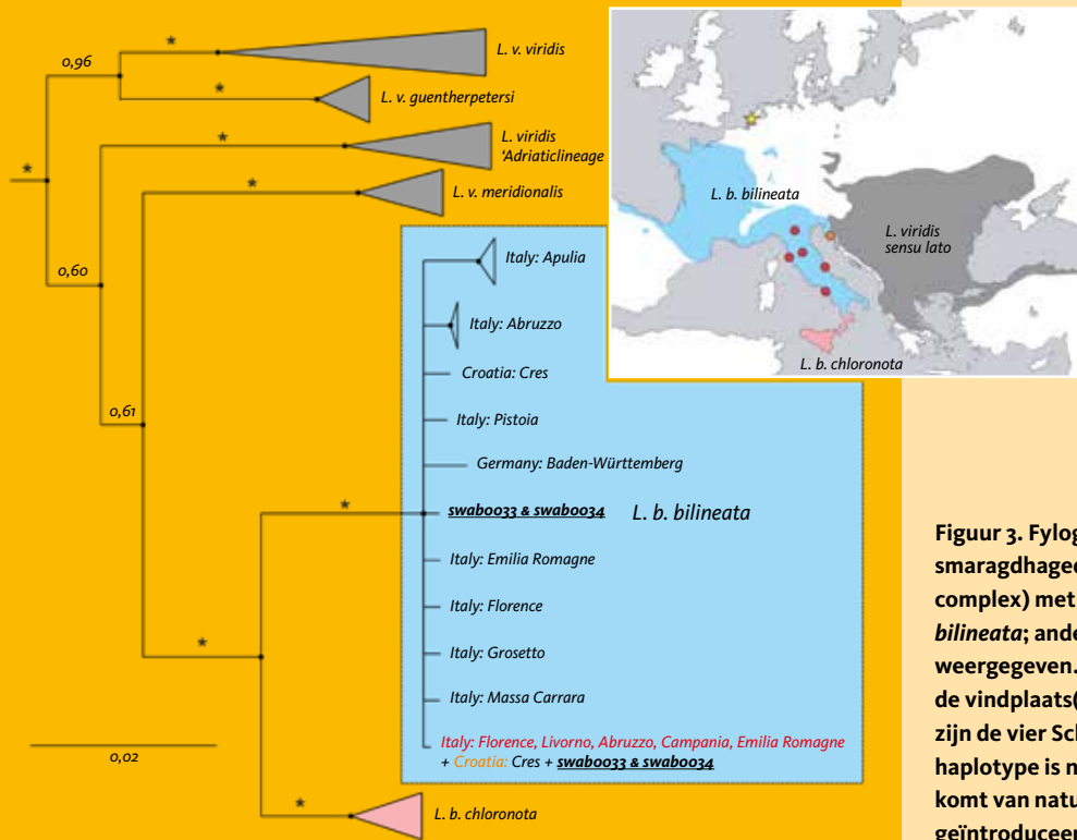
Figuur 3. Fylogenetische boom voor smaragdhagedissen ( Lacerta viridis-bilineata complex) met de focus op Lacerta bilineata bilineata ; andere taxa zijn versimpeld (◁) weergegeven. De verschillende haplotypen hebben de vindplaats(en) als label. De codes swaboo32-35 zijn de vier Scheveningse individuen (☆). Eén haplotype is niet eerder aangetroffen, het andere komt van nature voor in Italië (●) en is geïntroduceerd in Kroatië (○).

wegvangactie in 2018 zijn in totaal elf smaragdhagedissen weggevangen en bekend is dat er gelijktijdig ook door derden dieren zijn weggevangen. In 2019 zijn nog tenminste vijf verschillende adulte exemplaren en één subadult exemplaar gezien. Tijdens drie inventarisatierondes in 2017 voor zandhagedis is door Backx (2017) een maximum van vijf smaragdhagedissen per ronde gevonden. Voor de zandhagedis was dit maximum toen zes dieren. Daarbij moet wel worden opgemerkt dat volgens een lokale geïnteresseerde in de weken voorafgaand aan deze inventarisatie door derden circa 35 zandhagedissen (illegaal) waren weggevangen. Hoe betrouwbaar deze aantallen zijn is onduidelijk, maar de aanwezigheid van potvallen om hagedissen te vangen maakt het gegeven van wegvangst door derden wel zeer aannemelijk.