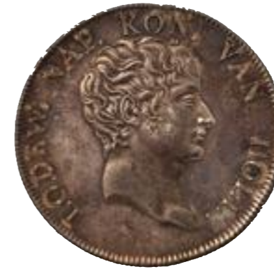
Rijksdaalder van het Koninkrijk Holland, 1809, met beeltenis van Lodewijk Napoleon Bonaparte. Rijksmuseum, Amsterdam.

Het beroemdste voorbeeld van een Nederlandse auteur die met de censuur te maken kreeg, is Jan Frederik