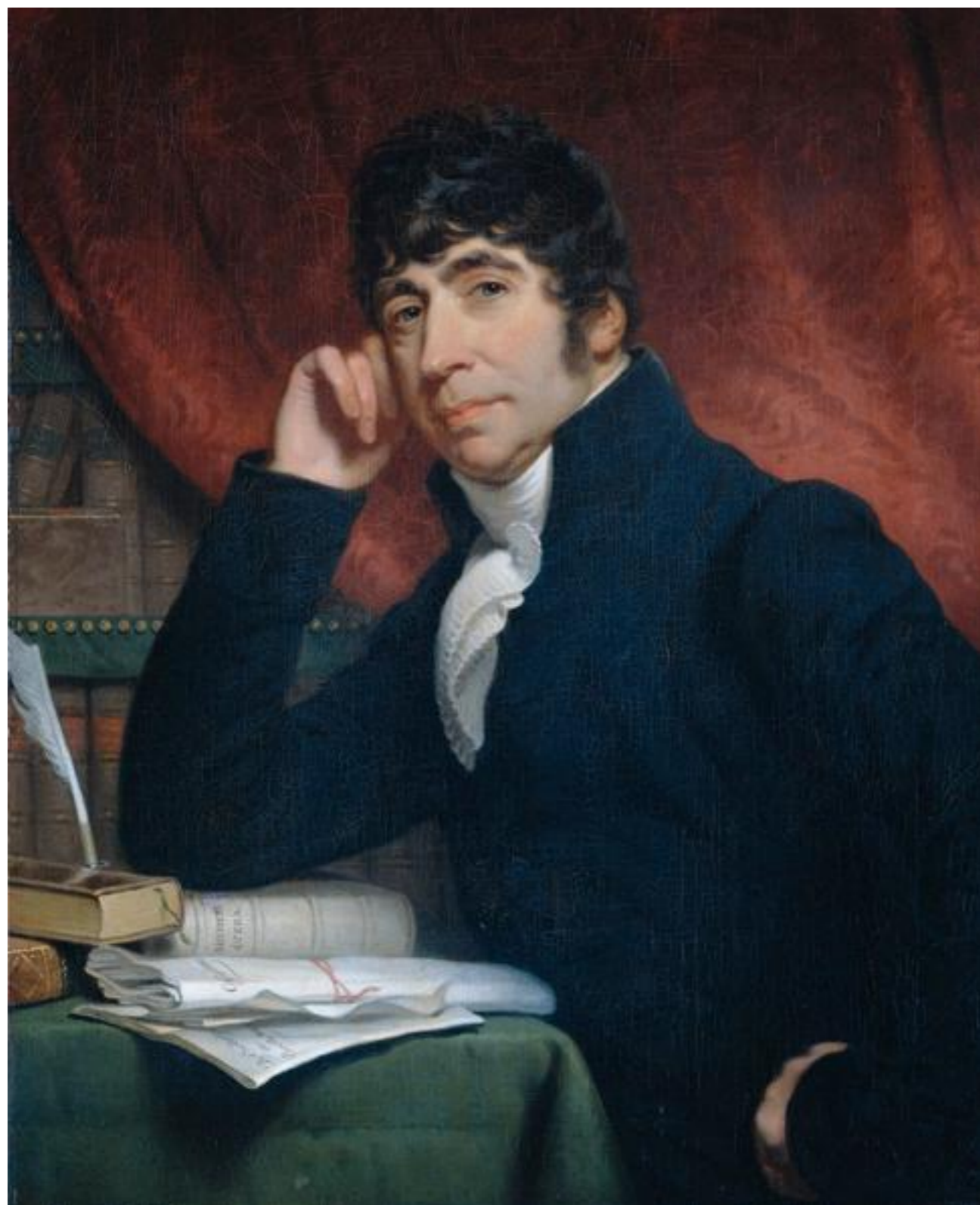
Willem Bilderdijk (1756-1831) geschilderd door Charles Howard Hodges in 1810.