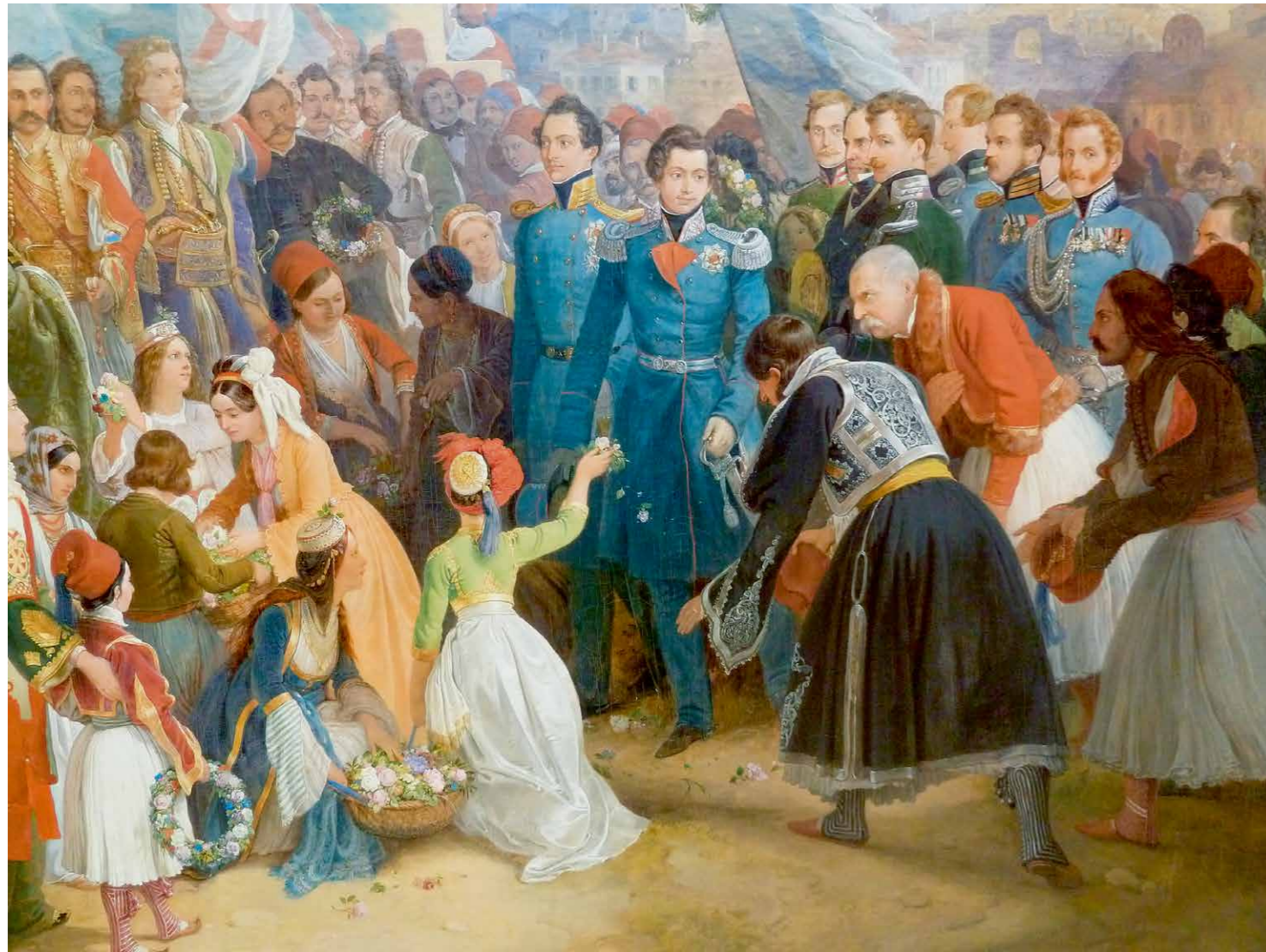
Aankomst van koning Otto te Athene, 1834 | PETER VON HESS, 1839 (NEUE PINAKOTHEK, MÜNCHEN)

grootgrondbezitters, de grote redersfamilies en de helden van de Opstand. De strijd tegen hun 'regionalisme' was voor hem noodzakelijk vanuit zijn moderne politieke agenda, maar critici verweten hem een pion van buitenlandse mogendheden of zelfs een dictator te zijn. Feitelijk bekleedde hij een onmogelijke positie tussen alle botsende belangen in: 'Niemand doet zijn plicht. Het leger, de vloot, de politieke leiders, ze zijn allemaal corrupt. Ik krijg geen enkele steun en wat kan ik alleen doen? God heeft me intelligentie gegeven, maar hij heeft me geen macht gegeven om mannen te kneden.'