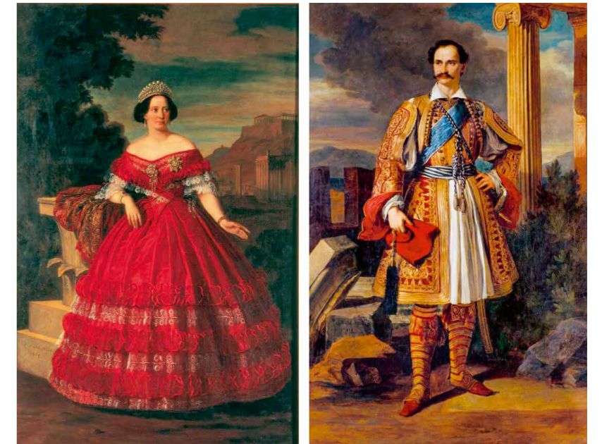
Amalia en Otto, het Griekse koningspaar

een ware 'grecofiel', kleepte zich doorlopend in Griekse dracht, leerde snel Nieuwgrieks en trok door zijn koninkrijk om de bevolking en gewoonten te leren kennen. Maar de aanwezigheid van zijn Beierse adviseurs, 3500 eigen troepen en de 'molensteen' van diverse buitenlandse leningen maakten zijn positie lastig. Voor Grieken was er onder zijn absolute bewind niet of nauwelijks plaats. Dat veranderde pas toen hij in 1843 een grondwet moest toestaan. Zijn populariteit had ook te leiden onder het feit dat het koninklijk paar weigerde over te gaan tot het orthodoxe geloof, en dat hun huwelijk tot overmaat van ramp kinderloos bleef.