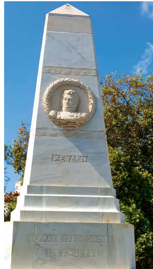
Monument ter ere van 'Heiden' in Pylos

Op 12 september 1829 vond de laatste veldslag plaats, bij het dorp Petra (tussen Livadiá en Thiva). In die gebeurtenis schuilde een zekere symboliek, want het was de Griekse aanvoerder Dimitrios Ypsilandis die de eer had om de oorlog te beëindigen die zijn broer Aléxandros, voorman van de Filikí Etería , in 1821 aan de oevers van de rivier Proet begonnen was.