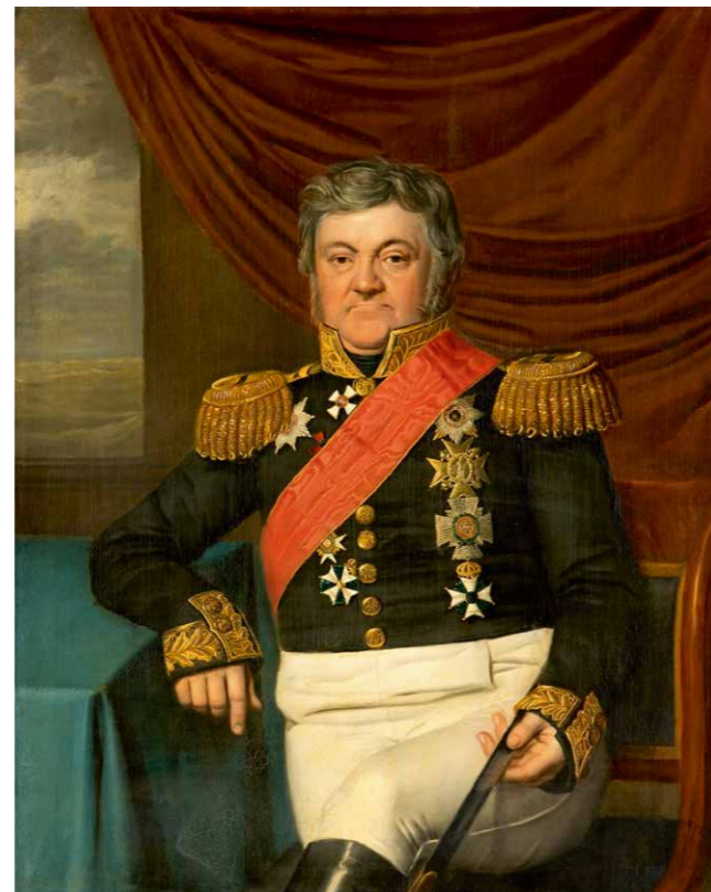
Admiraal Lodewijk van Heiden

De Ottomanen leken het verzet van de opstandelingen gebroken te hebben, maar het lot was de Grieken goed gezind. Er kwam eindelijk, na jaren van passieve diplomatie, een officiële interventie van de grote mogendheden. Groot-Brittannië, Frankrijk en Rusland namen het voortouw. Zij waren tot de