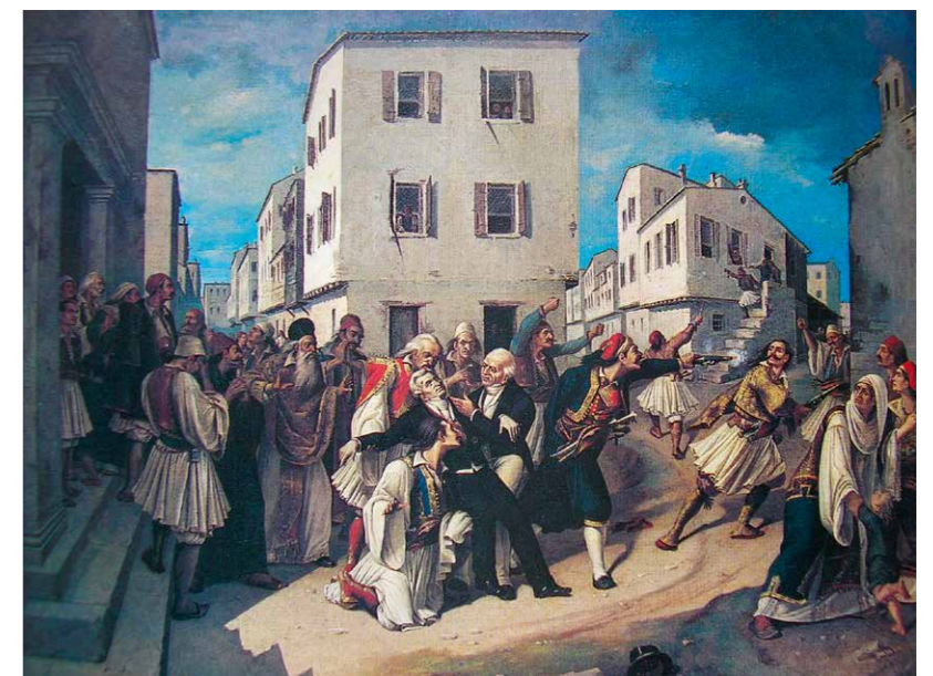
Charálambos Pachis, de moord op Kapodistrias Munt van 20 eurocent met Kapodistrias

Kapodistrias bracht een ambivalente persoonlijkheid mee naar zijn nieuwe (vader)land. Hij was zeer hardwerkend en geliefd bij het volk, maar opereerde ook autoritair en als een echte 'control freak', die er uiteindelijk niet in slaagde om de maatschappelijke tegenstellingen op te lossen. Zijn autocratische bewind (naar Russisch model) zette veel kwaad bloed, omdat hij als hervormer de traditionele machtsverhoudingen te lijf ging. Al snel kwam hij daarmee in conflict met de