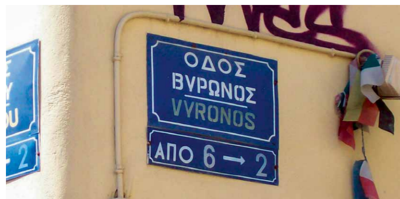
Odós Výronos, Byronstraat

Het uitbreken van de opstand in 1821 leidde dan ook tot geestdriftige activiteiten onder westerse intellectuelen, die hoopten dat de gedroomde herleving van het antieke Griekenland nu daadwerkelijk gestalte zou gaan krijgen. Vooral