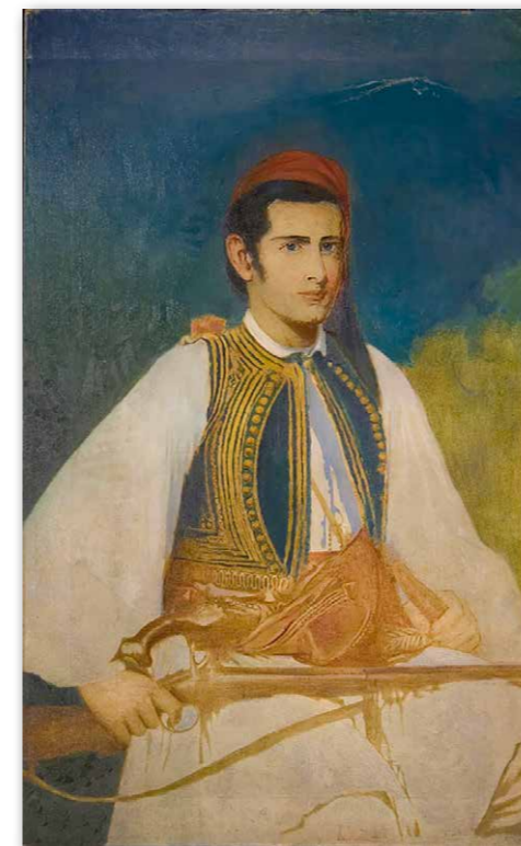
Samuel Gridley Howe (1801-1876), Amerikaans arts en filhelleen