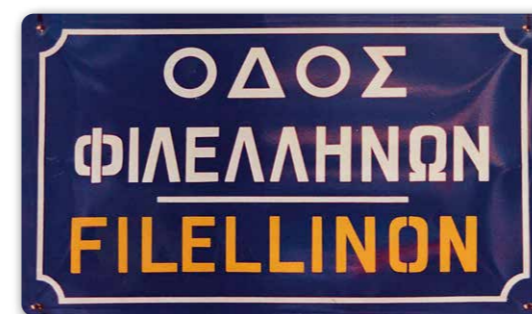
Odos Filellinon

Van doorslaggevend belang was het optreden van één man: de Britse schrijver, dichter en politicus George Gordon, beter bekend als Lord Byron. Als absolute superster van de Romantiek had hij met zijn meesterwerk Childe Harold's Pilgrimage (1811) – het resultaat van een eigen 'Grand Tour' langs onder andere Ioánnina, Delphi en Athene – in hoge mate bijgedragen aan de veelgehoorde wens tot herleving van de klassieke Oudheid. Het bezoek maakte een verpletterende indruk op hem. En waar veel van zijn standgenoten met misbaar naar de lokale bevolking hadden gekeken, had Byron wel compassie met de contemporaine Grieken. Bovendien zag hij in hun strijd de uitgelezen gelegenheid voor het vervullen van zijn eigen lotsbestemming.