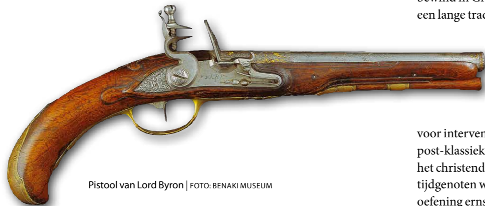
Pistool van Lord Byron

het tirannieke en onmenselijke karakter van het Ottomaanse bewind in Griekenland. Er bestond sinds de Kruistochten een lange traditie om 'de Turk' als barbaar te zien, iemand die de dappere en deugdzaame Grieken mishandelde en afperste, en vrouwen, kinderen en jongens tot slaaf maakte. Voor enige nuance was in dit beeld, al dan niet bewust, geen ruimte.