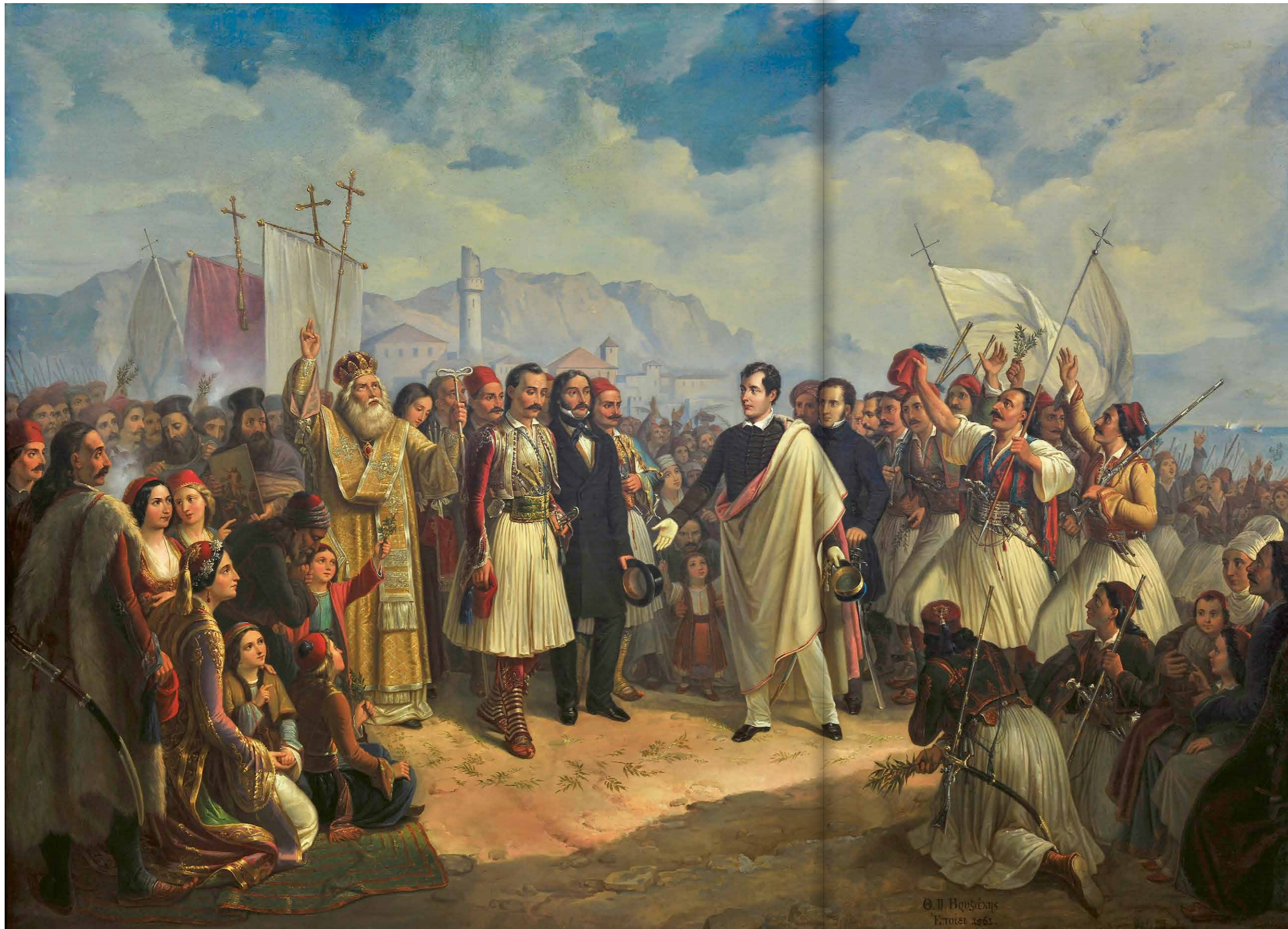
Ontvangst van Lord Byron in Mesolongi, Theodoros Vryzakis, 1861 | Nationale Pinakothek, Athene

Geheel in stijl met zijn literaire leidmotief, de eenzame held die het opneemt voor de onderdrukten, trok ook hij naar Griekenland. Via Kefaloniá kwam hij aan in Mesolongi, de stad aan de westkust die onlosmakelijk verbonden is geraakt met het heroïsche verzet van de burgerbevolking tegen de Ottomaanse bezetter. Byron kwam niet met lege handen: uit eigen middelen bracht hij € 20.000 mee, destijds een behoorlijk bedrag. Ter illustratie: om dat laatste kapitaal te kunnen schenken, verkocht hij zelfs zijn landgoed Rochdale Manor! Maar zijn missie was niet enkel persoonlijk. Namens het London Greek Committee was hij gerekruteerd om met het aanbod van een zeer substantiële lening (€ 800.000) contact te leggen met het voorlopige bestuur van de opstandige natie.