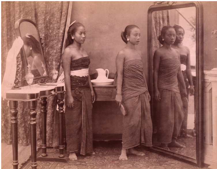
◀ Vrouwen poseren bij een spiegel en een kaptafel te Surakarta, 1888.