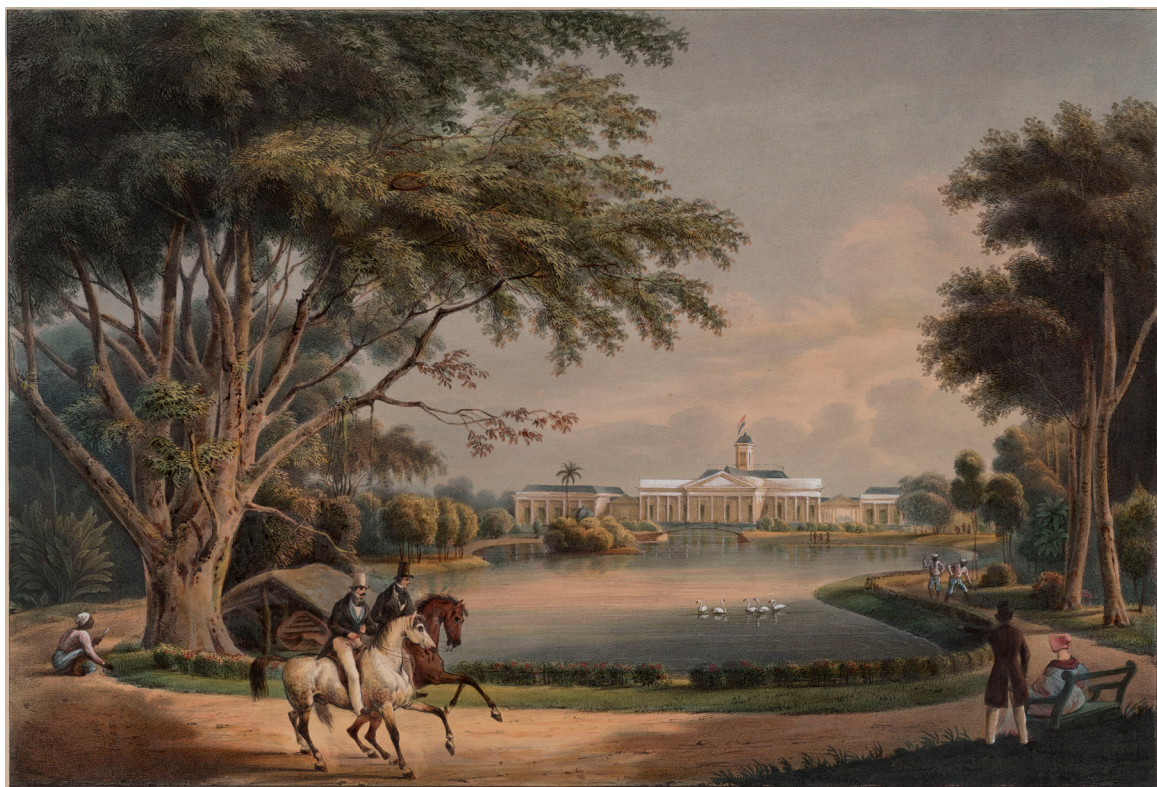
△ ‘Vue du palais de Buitenzorg’, W.J. Gordon naar A.J. Bik, uit: Vue prise des domaines de Koeripan, appartenant a Mr.J.J. van Braam. Amsterdam 1842. Collectie Universiteitsbibliotheek Leiden, KITLV 47B23.