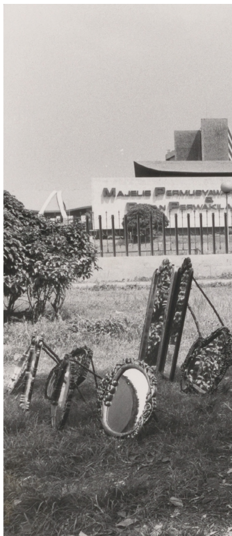
► Spiegelhandelaars tegenover parlementsgebouw in Jakarta, 1985.