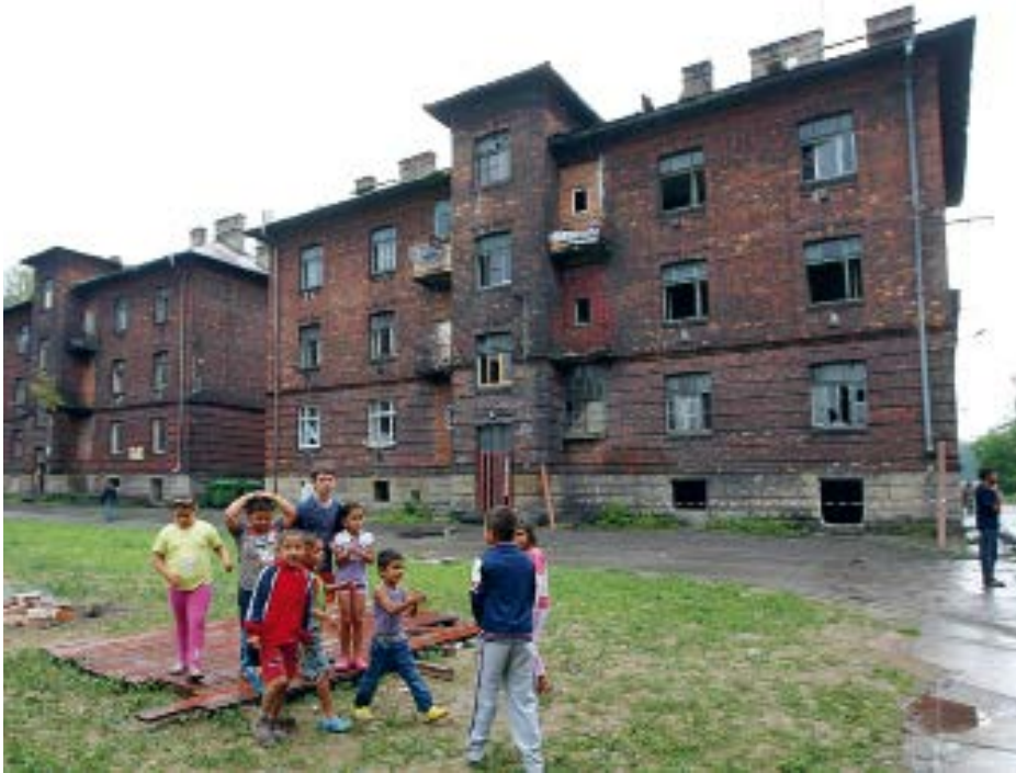
Afb. 16 Een sociaal geïsoleerd woonoord in Ostrava (2015). Roma kinderen in een getto in de wijk Přednádraží in Ostrava, in 2015. In 2019 zijn deze woonblokken afgebroken.

reactie op sociale wetenschappers en ngo's die in de jaren negentig met etnisch neutraal taalgebruik stigmatisering van Roma hadden willen vermijden. Maar inmiddels was voor de plekken met een hoge concentratie aan Roma het woord getto geïntroduceerd. In de hoop dat het pejoratieve getto niet de gangbare term zou worden, was in 2006 gekozen voor de expliciete aanduiding 'sociaal geïsoleerde Roma woonoorden'. Maar die opzet slaagde niet. Toen in 2015 de nieuwe breed opgezette studie uitkwam, de eerdergenoemde Analysis of socially excluded localities in the Czech Republic , werden inmiddels door het algemene publiek maar ook in serieuze kranten sociaal geïsoleerde woonoorden en getto's als synoniemen beschouwd. 54