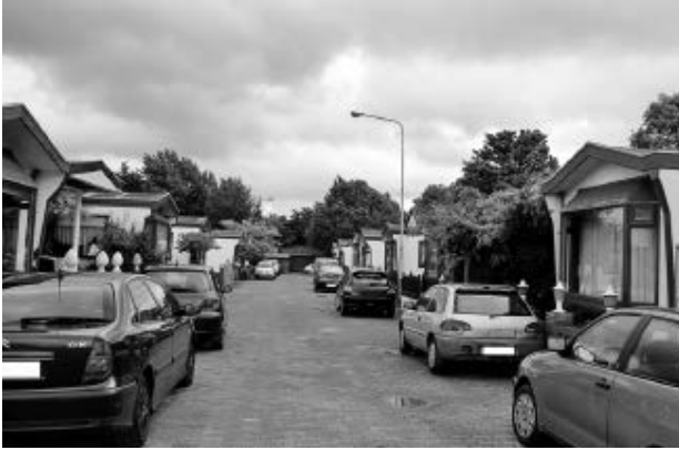
Afb. 17 Woonwagencentrum Molenhof in Rijswijk vóór de renovatie van 2014. Volgens de brandveiligheidsnormen stonden de woonwagens te dicht op elkaar.

en/of Roma, maar dat mengde niet altijd goed. In de jaren tachtig gaven Sinti en Roma tegenover Overbekking e.a. te kennen het liefst op een niet te groot kamp te willen wonen met de eigen familie en zonder andere woonwageneigenaren. 75 Wel stuitte de strikte handhaving op de nieuwe kleinere kampen op weerstand. Op een standplaats mocht maar één auto staan en schuurtjes op het kamp om aan auto's te werken waren verboden. Dat werd als bemoeizucht ervaren, temeer omdat Roma en Sinti eraan gewend waren dat het leven in een woonwagen zich buiten het zicht van de overheid afspeelde. Hoewel ze beschut wilden wonen en niet naast een kerkhof, vuilnisbelt, spoorlijn of drukke verkeersweg, gaven ze er de voorkeur aan om aan de rand van de bebouwde kom te wonen. Liefst bleven ze ver weg van de 'burgers', zodat die hen niet in de gaten konden houden. Het was dus niet zo dat zij zich vanwege de geïsoleerde ligging van een kamp voelden weggestopt, het isolement werd juist op prijs gesteld. 76