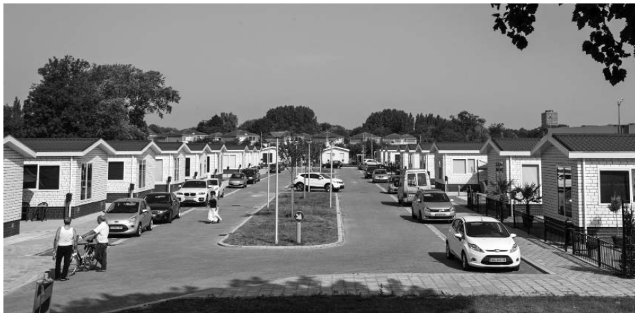
Afb. 18 Woonwagencentrum Molenhof in Rijswijk, na de renovatie in 2014. Door de bredere opzet, meer ruimte tussen de wagens en de aanleg van een straat met een middenberm en aan weerszijden parkeerhavens en een trottoir, kreeg het woonwagencentrum meer het karakter van een gewone woonwijk.