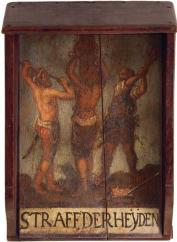
Afb. 4 Geselbord Straff der heijden (ca. 1710). Dit zogeheten geselbord hing begin achttiende eeuw aan de Kraanpoort in Roermond. Het toont wat 'zigeuners' te wachten stond als ze de stadspoort zouden binnengaan. De beul rechts afgebeeld geeft de vastgebonden 'zigeuner' een afranseling met een takkenbos, de beul links met een stok. Rechtsonder staat een bak met gloeiende kolen en een brandijzer. Collectie: Het Historiehuis in Roermond, archiefnr. 1864.