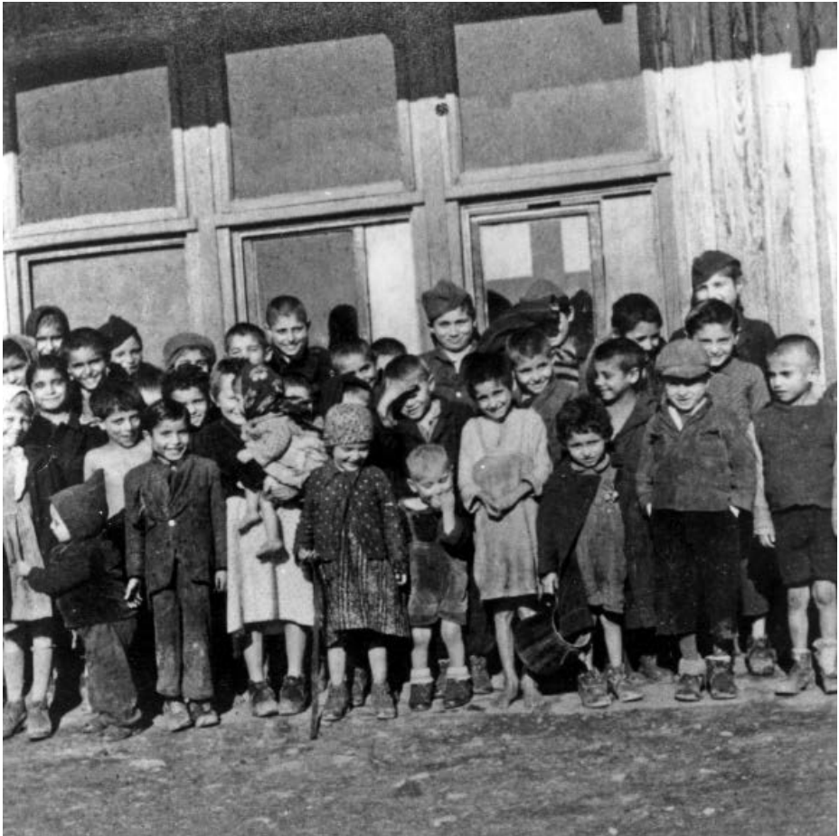
Afb. 8 Roma kinderen in gevangenschap in concentratiekamp Lety u Písku. Tijdens de Tweede Wereldoorlog waren er in het huidige Tsjechië twee interneringskampen waar alleen Roma gevangengezet werden, Lety u Písku en Hodonín. Een groot aantal gevangenen, onder wie het merendeel van de kinderen, verloor in die kampen al het leven door ziekte, honger en kou. De meesten die Lety of Hodonín wisten te overleven, werden gedeporteerd naar Auschwitz en daar vermoord. Foto: fotograaf onbekend, vermoedelijk een kampbewaker; datering ca. 1940-41, vóór de uitbraak van de tyfusepidemie in 1942. Collectie: Akademie věd České republiky in Praag, inventarisnr. 95179HK.

In Nederland werden tijdens de Duitse bezetting eerdere beleidsplannen uit de jaren dertig verwezenlijkt om 'zigeuners' en woonwagenbewoners te registreren, hen een trekverbod op te leggen en onder te brengen in bewaakte verzamelkampen. 73 Op 16 mei