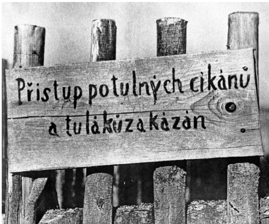
Afb. 6 Verbodsbord voor 'zigeuners' (jaren dertig). 'Verboden toegang voor rondtrekkende zigeuners en landlopers'. Het ontzeggen van de toegang voor 'zigeuners' tot bepaalde regio's in Tsjechoslowakije werd in 1927 bij wet vastgelegd. Foto: fotograaf onbekend. Collectie: Muzeum romské kultury in Brno, archiefnr. F 417/98/inv/F/1711.

ten en bladen berichtten vanaf eind jaren twintig over een 'zigeunerschool' in Uzhorod. In het Algemeen Handelsblad van 2 juni 1929 werd de school 'Een Europeesch curiosum' genoemd, en ook een 'Poging tot oplossing van het Zigeunervraagstuk'. 43