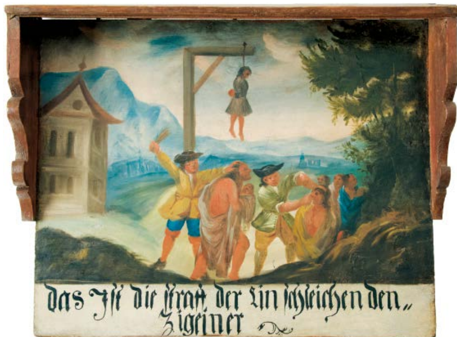
Afb. 5 Geselbord 'Das ist die Straff der einschleichenden Zigeiner' (begin 18 e eeuw). Dit geselbord moest 'zigeuners' afschrikken om de grens tussen het huidige Tsjechië en Oostenrijk te passeren. Het 'einschleichen' (binnenglippen) zou 'zigeuners' komen te staan op een afranseling, het afsnijden van het rechteroor of ophanging. Collectie: Nationaal Erfgoed Instituut in Nové Hradý, archiefnr. NY00504. Dit instituut heeft nog twee andere vroegachttiende-eeuwse geselborden in de verzameling.

hun paard en wagen afstaan en mochten zonder toestemming het dorp niet meer verlaten. 34 Ze mochten geen cigany meer genoemd worden maar Ujmagyar , 'Nieuwhongaren'. Ze werden verplicht tewerkgesteld door de lokale adel in een arbeidsverhouding die sterk deed denken aan lijfeigenschap. Ook mochten ze zich niet langer onderscheiden door eigen kleding, taal of beroep. Vanaf 1773 gold een verbod op huwelijken tussen 'zigeuners' onderling; 'zigeuner kinderen' ouder dan vijf werden ondergebracht in 'niet-zigeuner families'. 35