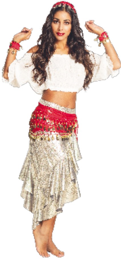
Afb. 7 Verschillende webwinkels, zoals party.nl, vegao.nl en funidelia.nl hebben 'zigeunerin-outfits' in het assortiment. Deze verkleedkleden verwijzen, in lijn met de romantische 'zigeunerinnentraditie', naar stereotypen als sensualiteit, muzikaliteit en avontuurzucht.

een realistisch geschetste liefdesrelatie tussen een loodgieter en een Roma vrouw tegen de achtergrond van de politieke situatie in Tsjechoslowakije. 59