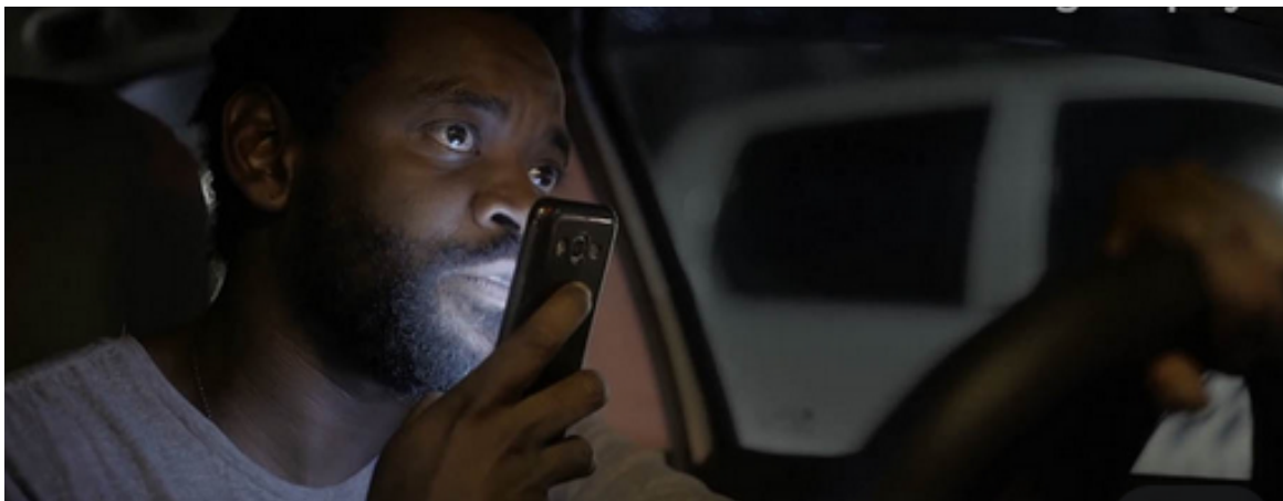
Figura 1 - Screenshot do filme Breve miragem do sol (dir. Eryk Rocha, 2019)

luzes evanescentes que provêm do espaço além do carro. Essa fantasmagoria parece sugerir a posição complexa da Paulo (e o espaço do carro) frente à cidade – ao mesmo tempo distante, violenta, estranha. [Fig 1 & 2]