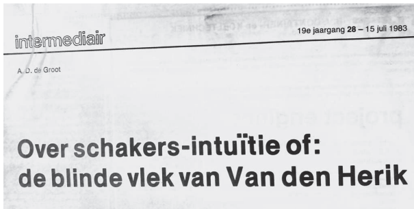
Adriaan de Groot, Intermediair , 1983.