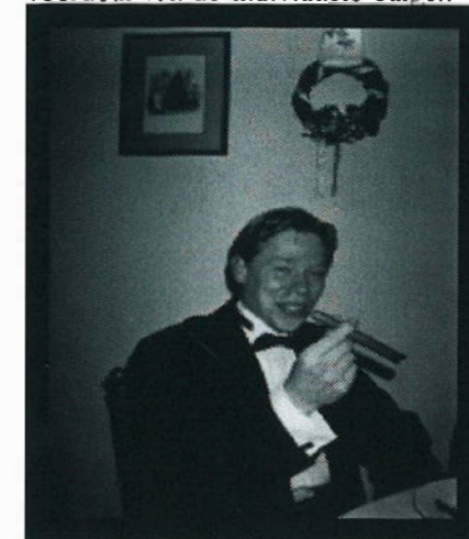
De overheid kan middels een aantal belangrijke stappen trachten het burgerlijk verantwoordelijkheidsgevoel te vergroten:

gers bewezen dat zij eigen verantwoordelijkheden niet altijd aankunnen. Stoppen met gedogen heeft echter alleen zin wanneer de politie voldoende capaciteit heeft om misdaden of overtredingen ook daadwerkelijk aan te pakken. Op dit Teneinde de veiligheid te verhogen, pleit Lutken voor een integraal veiligheidsbeleid waarbij alle gemeentelijke diensten worden gemobiliseerd. Een schitterend streven, op het feit na dat de belangrijkste actor, de burger zelf buiten beschouwing wordt gelaten. De politie kan niet alle problemen op het gebied van veiligheid, openbare orde en vervuiling zelf aan, vermoedelijk ook niet in samenwerking met andere instanties (zoals de Riagg), daar deze zelf vaak ook zwaar belast zijn. De greep op het publieke domein die Lutken zo graag wil herstellen, zal weinig kans hebben indien burgers niet worden betrokken bij het veiligheidsbeleid. Het openbaar bestuur zal moeten appelleren aan het burgerlijk verantwoordelijkheidsgevoel. Dit zal verder moeten gaan dan de eigen voordeur van de individuele burger.