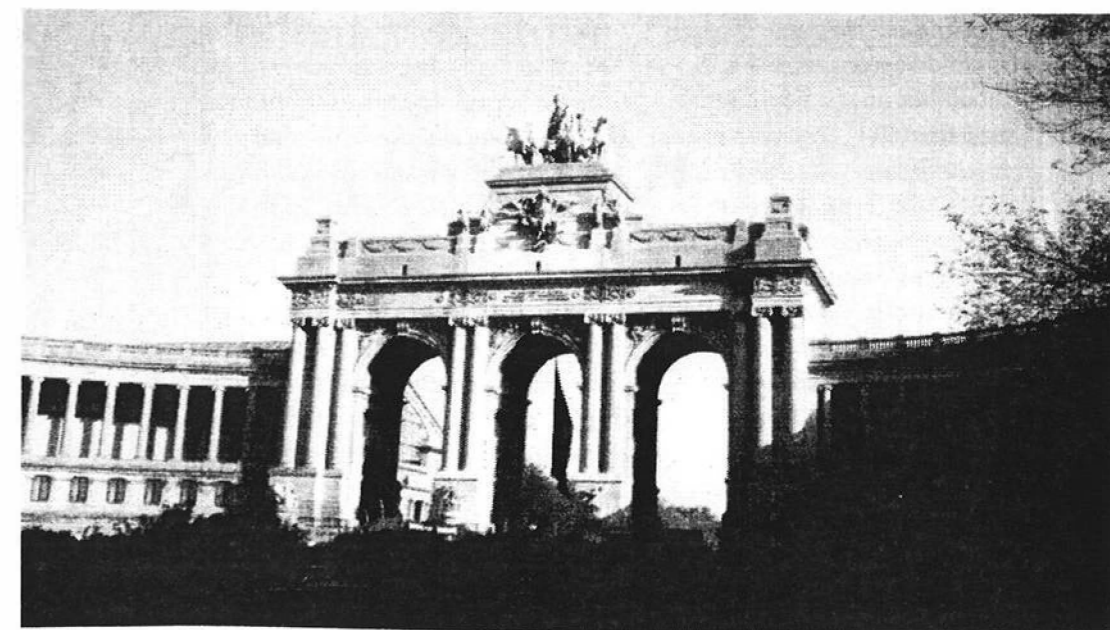
Brussel - Parc du Cinquantenaire

Schijnbaar simpele, getalsmatige kwesties. Het zijn echter wel de institutionele fundamenten van de Unie. Het gaat om de machtsverhoudingen. Verhoudingen die niet alleen praktisch zijn, maar ook (vooral?) symbolische waarde hebben. Het gaat om de kleine landen die bang zijn gedomineerd te worden door de grote landen, het gaat om een groot en zelfbewuster Duitsland dat de positie verlangt die het op grond van het aantal inwoners 'hoort' te hebben en om Frankrijk dat dat anders ziet.