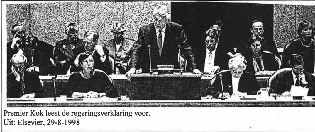
Premier Kok leest de regeringsverklaring voor. Uit: Elsevier, 29-8-1998

In een situatie die door 'peace enforcement' in plaats van 'peace keeping' wordt gekarakteriseerd zijn bo-