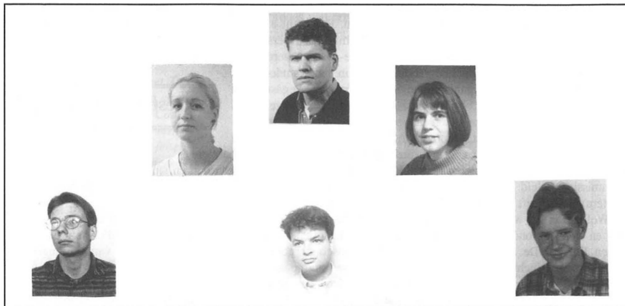
Enkele gezichten van de BEL-commissie die je met jouw problemen kunt benaderen

Ook willen we dit jaar, net als vorig jaar voor het eerst is gebeurd, een onderzoek doen onder de eerstejaars die besluiten te stoppen met hun studie bestuurskunde. Als laatste willen we dit jaar voor het eerst het doctoraal-III gaan evalueren. Het evalueren van het doctoraal-III kost echter veel tijd (te veel) tijd, daarom hebben we besloten om geen onderzoek per facet of veld te doen, maar een overall evaluatie.