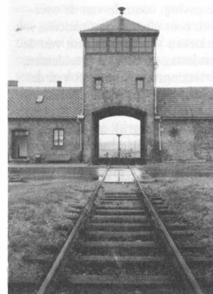
De toegangspoort tot het vernietigingskamp Birkenau

Na Auschwitz gingen we naar Birkenau, dit was het vernietigingskamp waar alleen maar mensen uitgemoord werden. We hadden ons laten vertellen dat de meeste gebouwen vernietigd waren en er dus niet echt veel meer te