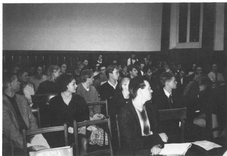
Stijve nekken, aandachtig luisteren, de karakteristieken van een symposium

spanning en aanpassing van de publieke sectoren in West-Europa. Het is echter niet alleen een kwestie van landelijke overheden die zich aanpassen aan de EU, de EU moet zich ook aanpassen aan haar rol.