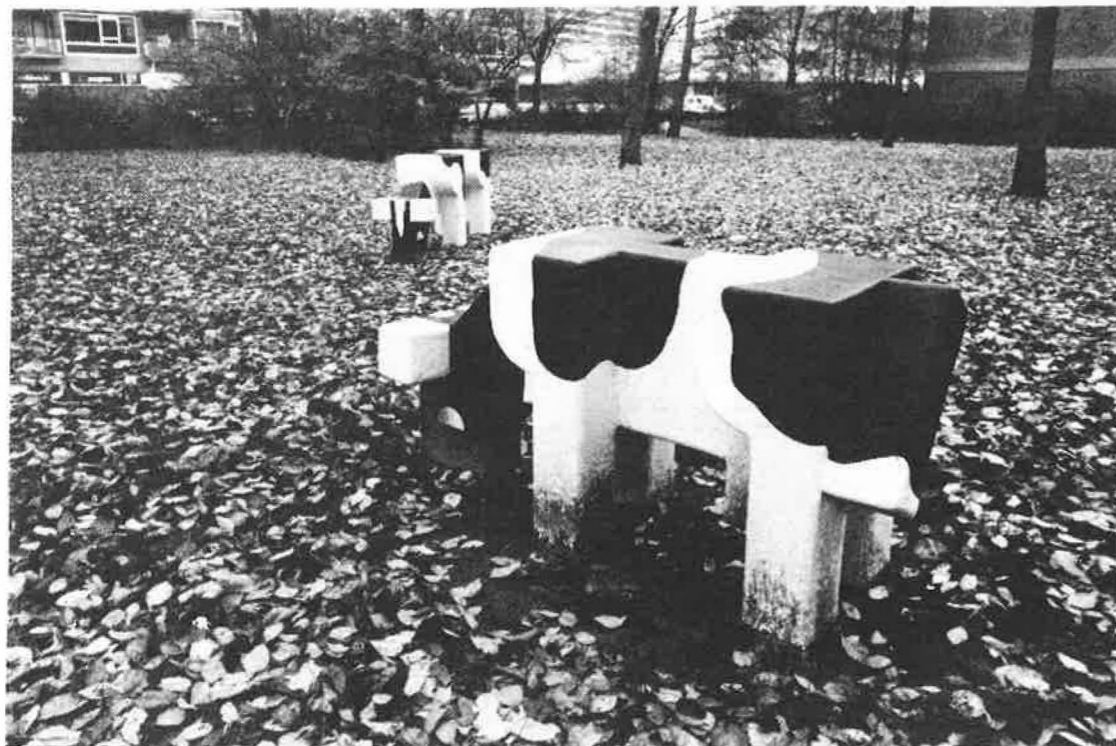
• Kunstkoeien moeten het woonplezier in de Poptahof verbeteren.

In de gemeente Delft is men al geruime tijd bezig met een eigen invulling van sociale vernieuwing. Het college van B&W heeft twee wijken aangewezen als proefbuurten voor het uitvoeren van de zogenoemde „speciale buuraanpak”: de Wippolder en de Poptahof. Deze keuze werd als