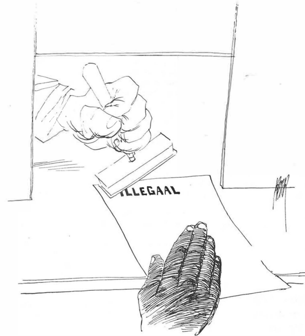
Illustratie: Peter (Vrij Nederland, 31 oktober 1992)

Die maandag kwam men massaal naar de Herengracht. Ongeveer 300 mensen kwamen vragen om legalisatie. De locatie was hiervoor niet geschikt, zodoende werden de mensen naar een naastgelegen grotere zaal gestuurd om aldaar een formulier in te vullen, waarop stond dat ze legaliteit zouden kunnen krijgen. Bovendien werden er persoonlijke afspraken gemaakt. Op woensdag en donderdag stond het wederom zwart van de mensen. Er kwamen zelfs bussen illegalen uit het buitenland. Daar hadden ze te horen gekregen dat men hier legaliteit kon krijgen. Uiteindelijk zijn er in totaal slechts zo'n 70 illegalen gelegaliseerd. Δ