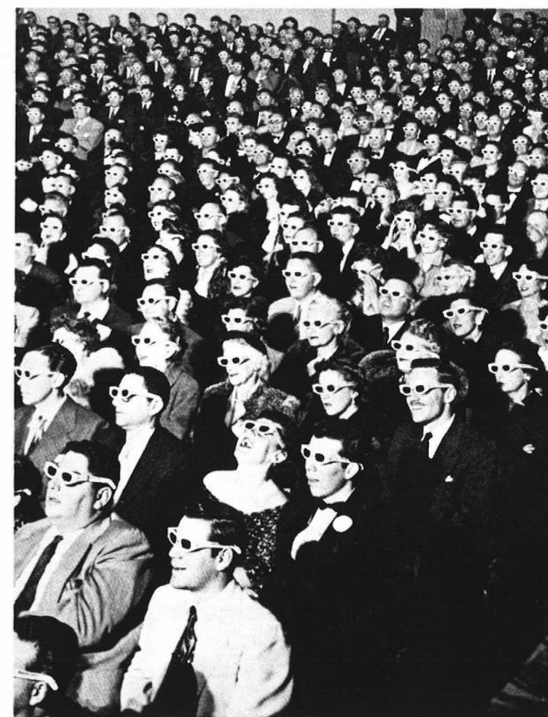
Twente en Leiden bekijken bestuurskunde door een andere bril

De visitatiecommissie is ook in Twente lang geweest. De voorlopige conclusie was over het algemeen positief te noemen. De organisatie heeft een logische opbouw, maar dit kan ertoe leiden dat er verstarring optreedt. Daarnaast vond de visitatiecommissie, dat al in DII tot specialisatie zou moeten worden overgegaan, zodat er meer verdieping kan plaatsvinden. Tevens pleitten de heren ervoor om de