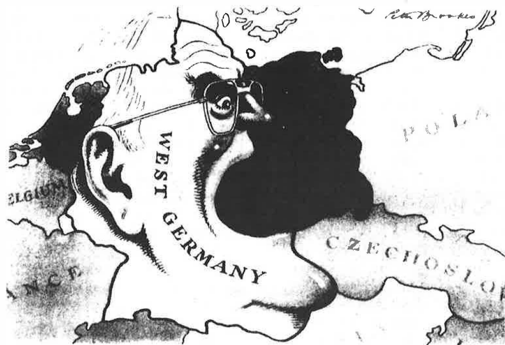
Een van de opgedane indrukken.

Na dit alles werden we op koffie met appelgebak getraakteerd door de B.I.L. bij Hotel des Indes.