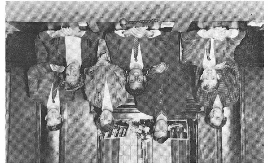
Voor de verzamelaars: Management upside-down

Zoals ieder semester heeft er ook dit semester een boekenverkoop plaatsgevonden. Eén punt is radicaal veranderd: de computer heeft zijn intreden gedaan. Rekeningen komen voortaan de printer uitrollen. Nog enkele nabestellingen moeten worden afgehandeld. Als nieuw initiatief stond er op 19 september een sportdag op het programma. Negenenvijftig mensen hebben actief meegedaan aan zaalvoetbal, volleybal en tafeltennis. Een