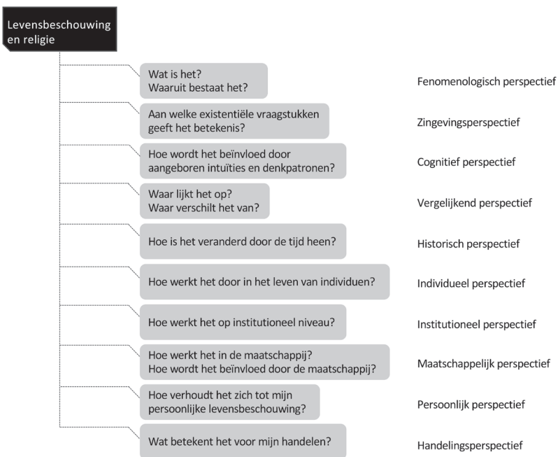
Figuur 1. Een perspectievenboom voor het vakgebied levensbeschouwing en religie

Figuur 1 geeft ons voorstel weer voor een perspectievenboom voor het vakgebied levensbeschouwing en religie. In de perspectievenboom hebben we de perspectieven/vragen in een inhoudelijk logische volgorde geplaatst: we beginnen met vragen over wat levensbeschouwingen zijn, gaan daarna door met vragen over hoe levensbeschouwingen werken en ronden af met vragen over wat levensbeschouwingen betekenen voor leerlingen. Dat wil echter helemaal niet zeggen dat de vragen in een gegeven onderwijssituatie ook in deze volgorde gesteld moeten worden. Vaak zal het juist beter werken om met het per-