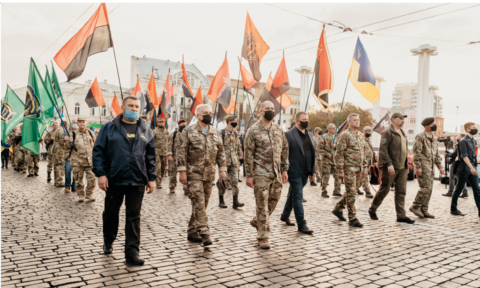
Twee beruchte voorbeelden van extremistische pro-Oekraïense strijdgroepen zijn Azov en Pravy Sektor ('Rechtse Sector'). Afgebeeld staan leden en aanhangers van Pravy Sektor tijdens een mars in Charkov in 2020