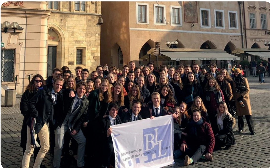
De groepsfoto van de Reis naar Praag uit 2020.