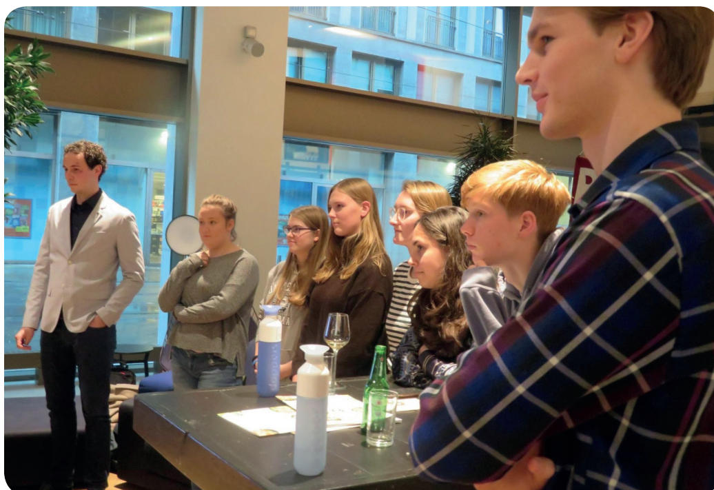
Een foto van Café de Campus: Drink & Discuss in november 2019.