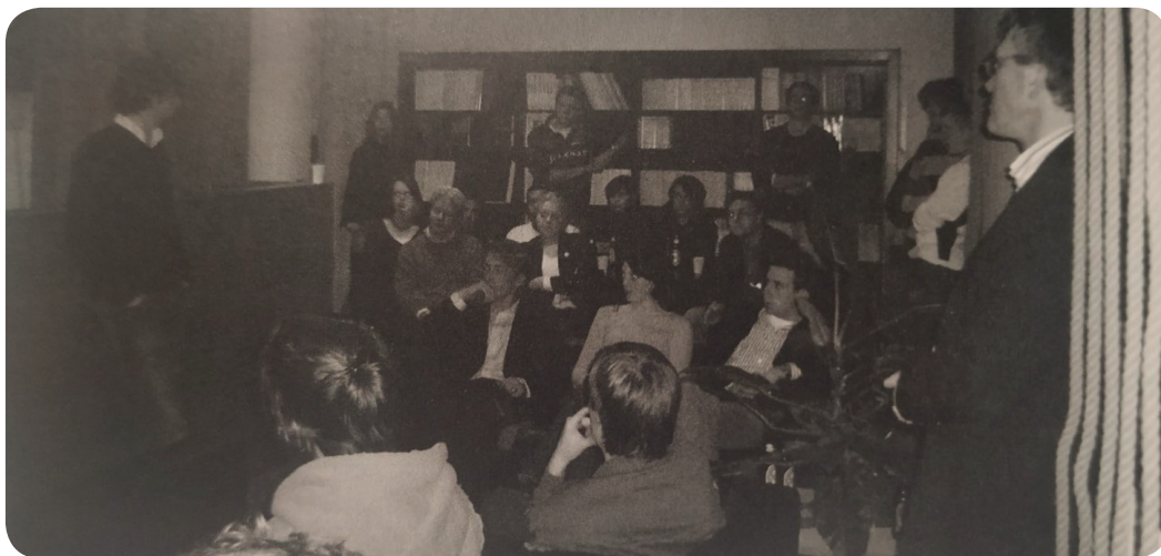
Een foto van Café de Vijfde, eind 2005.

De B.I.L. werkt graag samen met het Instituut Bestuurskunde. In 2005 werd voor het eerst Dialoog met de Vijfde (later hernoemd naar Café de Vijfde). Waar de docenten op een informele wijze de kans krijgen om meer te vertellen onder hun onderzoek of onderwijs. Tegenwoordig is er Café de Campus: Drink & Discuss. Hier ligt er meer de focus op het debat, ook dit is in samenwerking met verschillende docenten die in discussie gaan met de studenten over verschillende actuele stellingen.