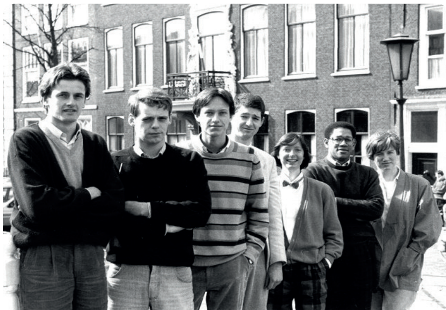
Het eerste bestuur der Bestuurskundige Interfacultaire vereniging Leiden.

Hieronder de foto's van het eerste en meest recente bestuur van de B.I.L.