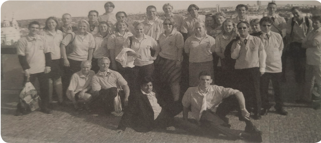
36 Een groepsfoto van de Reis naar Praag uit 2003.

Met de studiereizen gaat de B.I.L. de hele wereld over. Van Brussel naar Washington DC of van Praag naar Seoul. Overal worden wij met open armen ontvangen en wordt er veel tijd gestoken in het ontdekken van deze prachtige locaties. Een bezoek aan het parlement of de ambassade zijn traditie geworden. Eveneens als het ontdekken van de lokale barcultuur.