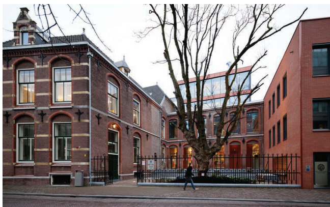
Hoofdlocatie aan de schouwburgstraat 3

College en wordt er voor werkgroepen uitgeweken naar lokalen in Stichtage boven het Centraal Station. Op het Lange Voorhout 44, tussen de ambassades, zit tevens de nieuwe B.I.L.-kamer. In dit oude pand wordt onder andere vergaderd door bestuur en commissies. Ook zijn er mooie zalen die voor borrels en andere verenigingsactiviteiten beschikbaar zijn. Zo zijn hier dit jaar al een ALV, nieuwjaarsborrel en studie-gerelateerde activiteiten gehouden.