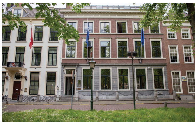
Het B.I.L. kantoor aan het Lange Voorhout 44

Al met al een hoop gebouwen, wat natuurlijk ook erg onhandig kan zijn. Dit probleem is vanaf 2016 echter opgelost, wanneer de nieuwe locatie Wijnhaven in gebruik genomen zal worden. Dit nieuwe gebouw zal zorgen voor voldoende ruimte voor alle studenten van de Faculteit Campus den Haag.