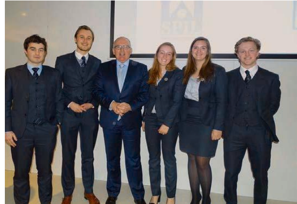
Het 30e bestuur met Frans Timmermans