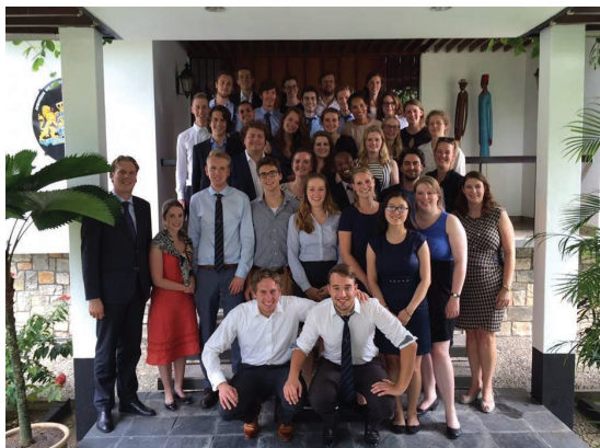
Bezoek aan de Nederlandse ambassade in Maleisië

25 juni is de lange reis van de B.I.L. met 40 man voor 10 dagen naar Kuala Lumpur geweest. De activiteiten bestonden onder andere uit het bezoeken van de ambassade, de universiteit van de stad, lokale bank en een aantal nederlandse organisaties. Daarnaast waren er informele excursies zoals quad rijden door de jungle en een bezoek aan het bekende formule 1 racecircuit.