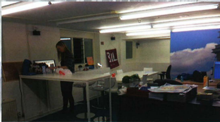
De nieuwe kamer in Den Haag

Het is nu januari, het is hartje winter en dit is goed te merken op het Lange Voorhout. De bladeren aan de bomen en op de grond hebben plaats gemaakt voor kale takken en een bevroren grindpad naar ons kantoor. Een goed moment om eens terug te kijken op de eerste maanden dat de B.I.L. een rol speelt in een nieuwe stad. Het kantoor is inmiddels ingericht. We beschikken