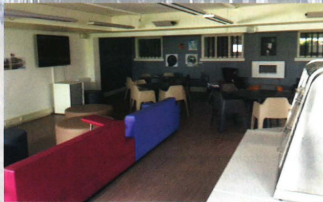
De Common Room

in de common room worden georganiseerd. De eerstejaars zijn en masse aanwezig, wat natuurlijk geweldig is. Ook steeds meer tweede- en derdejaars weten de weg naar het tweewekelijkse festijn te vinden, en dat is goed nieuws voor de Den Haag – Leiden bonding. Leiden wordt overigens niet achtergelaten voor wat het is. De After Tentamen Borrel vond uiteraard weer plaats bij Grand Café Van Buuren en tijdens het tweeletter (IL) en AraB.I.L.ian nights feest konden de Leidse studenten ook even stoom afblazen na alle studie uren. Naast activiteiten worden de eerste contacten in