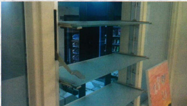
Een doorkijkje vanaf de kamer naar de Common Room

over twee bureaus met computers, een bank (met dank aan ons lieve zusje Emile) en een heuse koffiebier met een Senseo en Haagse Hopjes. Ook de verkoopbalie ontbreekt niet, en vergaderen is een stuk fijner door de prachtige vergadertafel die hier staat. De eerstejaars weten de B.I.L.-kamer gelukkig goed te vinden, al missen we wel de dynamiek van de FSW, waar altijd wel iemand komt buurten. Hier in Den Haag zijn de B.I.L.-diensten wel productiever, en komen de studenten vooral in vlagen na colleges. Het grootste succes hier tot nu toe zijn de borrels die