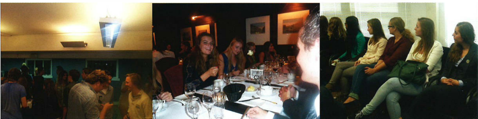
Vlnr: EJD-fotoborrel, B.I.L.-Diner, Eerstejaarsexcursie korps nationale politie