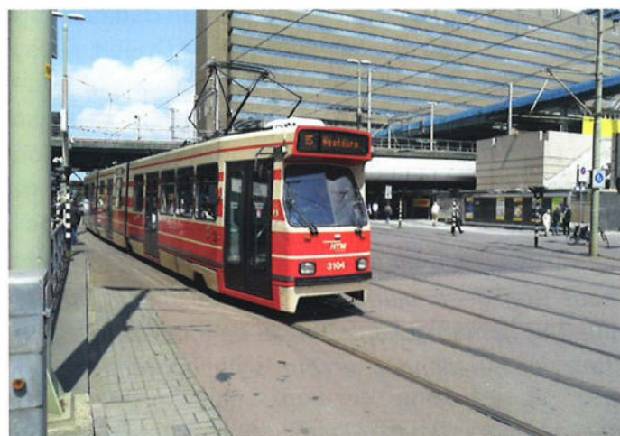
De HTM in regio Haaglanden heeft niet te maken met concurrentie aangezien er maar sprake is van één bidder

Er is openbaarvervoersbedrijven veel aan gelegen te weten of er in een aanbestedingsprocedure concurrenten zijn of niet. Zonder concurrentie is er voor die ene aanbieder namelijk 100 procent kans op de concessie, mits aan de vereisten en voorwaarden is voldaan. Die ene aanbieder wordt echter niet geprikkeld een scherpe prijs-/kwaliteitsverhouding te bieden: zolang het bod voldoet aan de voorwaarden en vereisten moet de aanbestedende de dienst in kwestie gunnen. Uit onderzoek Van Buiren et al. (2012) blijkt dat dit vermoeden opgeld doet. Concessies waarbij er in de aanbestedingsprocedure er meerdere bidders waren, kennen een hogere kwaliteit dan concessies waarbij in de aanbestedingsprocedure maar één bidder was. Voor veel concessies geldt dat er exploitatiebijdrage vanuit de betreffende overheid wordt vertrekt om de exploitatie van de concessie rendabel te maken. In aanbestedingsprocedures bieden bedrijven regelmatig onder meer op de hoogte van deze exploitatiebijdrage (hoe lager de gevraagde bijdrage, hoe hoger de puntentoekenning).