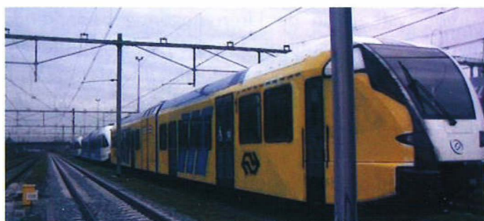
Dat niet iedereen het met de privatisering eens is moge duidelijk zijn. Hier schilderde vandalen uit protest een Arivatrein voor de helft over in NS-kleuren.

Met de Utrechtse Uithoflijn gaat het al niet veel beter. De Bestuursregio Utrecht heeft op 18 april 2012 definitief ingestemd met de aanleg van de Uithoflijn als de tramlijn tussen Utrecht CS en De Uithof. De bouw van de tramlijn naar de Uithof wordt flink vertraagd. De tram zou in 2018 moeten gaan rijden, maar dat wordt niet meer gehaald, doordat de minister de subsidie voor de Uithoflijn opschort. Met deze plannen gaat het openbaar vervoer er niet structureel op vooruit.