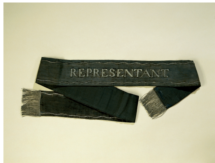
Sjerp van een van de leden van de Nationale Vergadering (collectie Rijksmuseum Amsterdam).

Niemand zal ontkennen dat de manier waarop deze grondwet er uiteindelijk zou komen, door middel van een staatsgreep en de politieke uitsluiting van grote groepen burgers, in democratisch opzicht geen schoonheidsprijs toekomt. Dit laat echter onverlet dat de democratisch verkozen Bataafse Nationale Vergadering het verdient te worden gecanoniseerd als een wezenlijk onderdeel van de politiek-bestuurlijke geschiedenis van Nederland. Haar recente musealisering door onze nationale erfgoedinstelling bij uitstek zal vermoedelijk verder bijdragen aan het proces dat hiertoe recentelijk in gang is gezet. ■