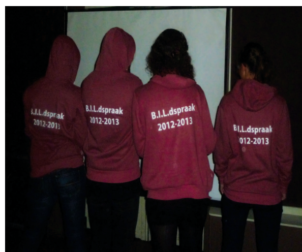
Commissie Bestuurskundige Berichten 2012-2013: B.I.L.dspraak