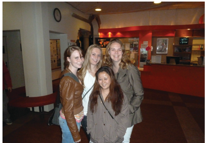
Verzamelen voor het uitgaan

Eenmaal uitgebuikt, bijgeslapen en opgemaakt vertrokken we later op de avond ter voet naar de Danzig. De muziek stond hard, foute tonen vlogen ons om de oren en het bier vloede rijkelijk. De B.I.L. was in haar element, dat was duidelijk te zien. Maar zelfs B.I.L.'ers krijgen na een tijdje last van moeheid. Helaas is daar maar één oplossing voor: slapen. Logisch denkend als wij waren, spoedden wij ons dan ook terug naar het hostel, een kleine tussenstop bij de snackbar daargelaten. Want de volgende ochtend om 9:00 uur was het alweer tijd om op te staan, er stond namelijk een beklimming van formaat op ons te wachten.