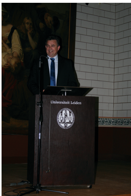
Emiel Roemer op de Van Braamlezing