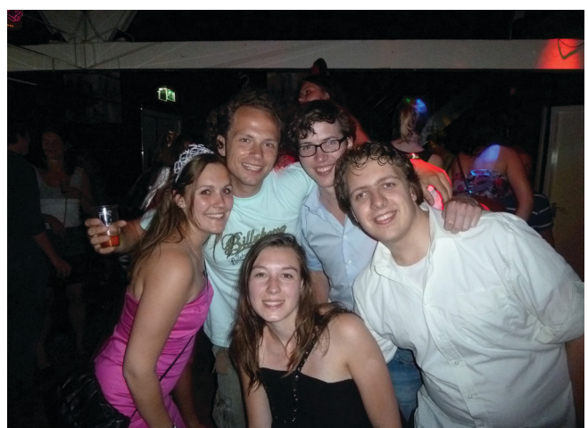
Fairy B.I.L.s feest

Als afsluiter van de geweldige week, was er vrijdag een diner in Den Haag gepland. De B.I.L. had georganiseerd dat wij naar de Popocatepetl konden op het Buitenhof in Den Haag. Erg gezellig en leuk om eens niet met de gebruikelijke mensen aan tafel te zitten. Na het voorgerecht zat iedereen al helemaal vol, zulke afgeladen borden met eten werden er geserveerd. Het was een hele gezellige avond, zoals een B.I.L.-diner hoort te zijn. ■