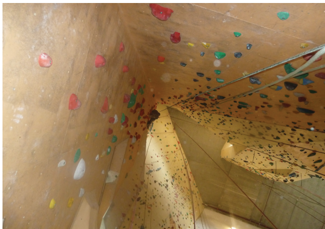
Klimmuur in De Uithof

De AlleJaarsDagen waren dit jaar wederom een succes! We hebben wederom aangetoond dat waar dan ook ter wereld, dus ook in Den Haag, de B.I.L. zich weet te vermaken. Vol goede moed vertrokken de deelnemers dan ook richting Den Haag Hollands Spoor, aangezien daar ons prachtige verblijf in de vorm van een hostel stond. Eenmaal ter plaatste werd de kamerindeling snel bekend gemaakt, zodat iedereen met een gerust hart kon gaan barbecueën. De weergoden waren ons echter niet goed gezind. Dit resulteerde in een storm, vanwaar de omvang en heftigheid het beste als onbeschrijfelijk beschreven kunnen worden. De B.I.L. laat zich echter niet uit het veld slaan. Al snel wist men een regeling te treffen in de vorm van een heuse