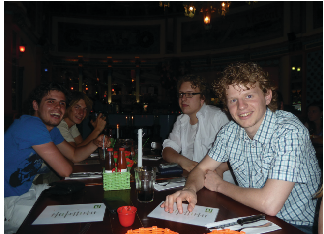
Dineren bij Popocatepetl

In de diesweek is het gebruikelijk dat de B.I.L. een feest organiseert, er is die week natuurlijk iets te vieren. Donderdag was het dan zover. Voorafgaand aan het feest was de oud-besturenborrel, het kwam daarom wat langzaam op gang. Later op de avond voegde dit gezelschap zich bij de rest en kon het