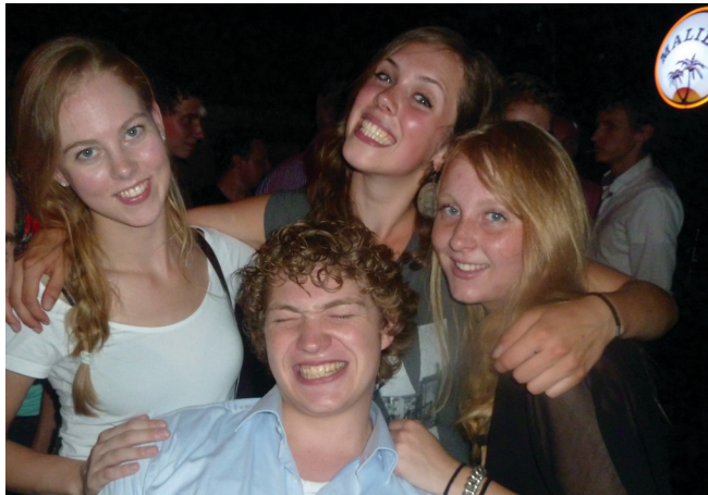
Deel van de Activiteitencommissie

De AlleJaarsDagen waren dit jaar wederom een succes! We hebben wederom aangetoond dat waar dan ook ter wereld, dus ook in Den Haag, de B.I.L. zich weet te vermaken. Vol goede moed vertrokken de deelnemers dan ook richting Den Haag Hollands Spoor, aangezien daar ons prachtige verblijf in de vorm van een hostel stond. Eenmaal ter plaatste werd de kamerindeling snel bekend gemaakt, zodat iedereen met een gerust hart kon gaan barbecueën. De weergoden waren ons echter niet goed gezind. Dit resulteerde in een storm, vanwaar de omvang en heftigheid het beste als onbeschrijfelijk beschreven kunnen worden. De B.I.L. laat zich echter niet uit het veld slaan. Al snel wist men een regeling te treffen in de vorm van een heuse