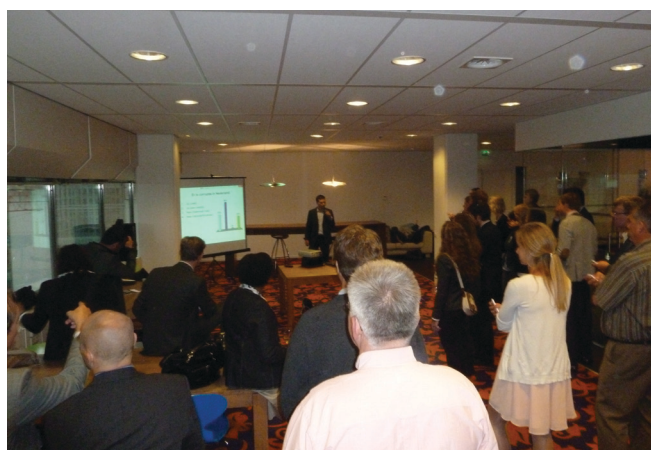
Stemmen over de stellingen

De jaarlijkse alumni activiteit van het Instituut Bestuurskunde heeft plaatsgevonden op donderdag 31 mei op de locatie Stichthage van de Faculteit Campus Den Haag van de Universiteit Leiden. De alumni hadden gedurende de avond uitgebreid de gelegenheid om bij te praten met oud-studiegenoten en te netwerken. Daarnaast bood het inhoudelijke programma genoeg stof waarover oud studiegenoten met elkaar van