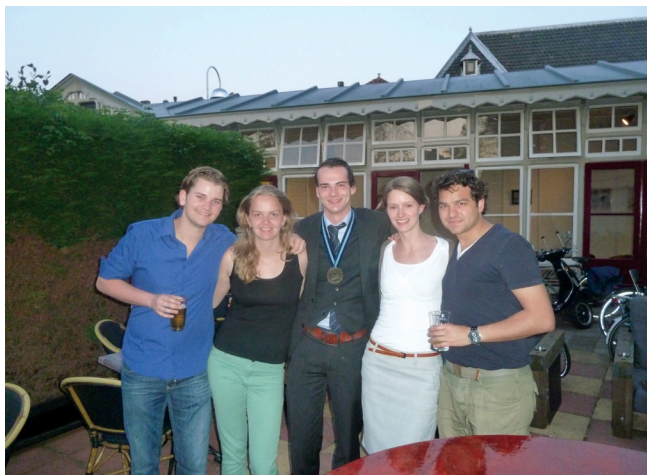
Commissarissen Buitenland op de oud-besturenborrel

Op woensdag was het tijd voor een actieve activiteit. De B.I.L. vertrok met een man of twintig naar Delft om daar te gaan paintballen. Er waren twee 'kampen' (Geel en Rood) ingedeeld die de strijd met elkaar aangingen. Op een gegeven moment durfde iedereen er vol voor te gaan en werd het een leuke strijd tussen de twee groepen. Kamp Rood veroverde uiteindelijk als eerste de vlag. Het was warme en sportieve middag.