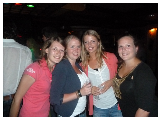
EJD in Noordwijk