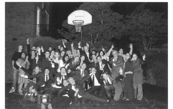
Studiereis naar Washington in 2008. Een bezoek aan de Nederlandse Ambassade waar ter gelegenheid van koninginndag een borrel werd georganiseerd.

Dat is toch de borrel bij de Nederlandse Ambassade tijdens onze reis naar Washington DC. We hadden toen de hele drankvoorraad van de residentie voor negen uur al weggewerkt. Gelukkig deden de ambassadeur en zijn vrouw vrolijk mee. Hetgeen mooie speeches en een memorabele groepsfoto opleverde! ■