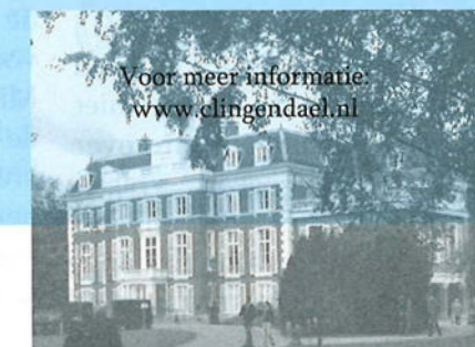
Voor meer informatie: www.clingenda.nl

Clingendael Het Nederlands Instituut voor Internationale Betrekkingen Clingendael is 25 jaar geleden opgericht als kennisinstituut voor de Internationale Betrekkingen. In een almaar veranderende wereld wil Clingendael een opleidingsinstituut zijn voor diplomaten en als denktank fungeren voor de overheid en het algemeen publiek. Om deze doelen te bereiken verricht Clingendael onderzoek, organiseert cursussen & lezingen en publiceert. Tot de doelgroep behoren journalisten, internationale politieke leiders, beleidsmakers, onderzoekers en andere geïnteresseerden. De onderzoeksonderwerpen lopen zeer uiteen. Zo zijn er wetenschappers die zich bezighouden met welke invloed de komst van China heeft als grootmacht in de wereldpolitiek. Anderen onderzoeken welk bestuursmodel het beste werkt in een postconflict land. De onderzoeken dienen vaak als advies voor beleid van het Ministerie van Buitenlandse Zaken, de Europese Unie, de Wereldbank of non-gouvernementele organisaties (ngo's).