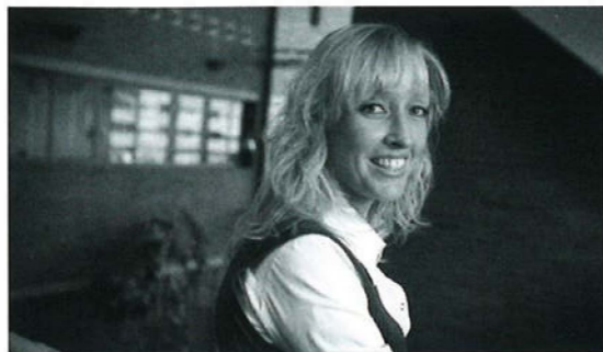
'Bij Maandag® denken ze ook vanuit van de gedetacheerde'

'Ik heb een goed contract. Eigenlijk merk ik nauwelijks dat ik gedetacheerd word. Wanneer mijn werk in Tilburg is afgelopen krijg ik gewoon doorbetaald. Maar omdat het ook in het belang van Maandag® is, hebben ze daarna waarschijnlijk meteen een nieuwe werkplek voor me. Ik zie het de komende jaren wel zitten op deze manier. Op termijn zou ik zelf grotere stedenbouwkundige ontwerpen willen maken maar dat duurt nog wel even, denk ik. Maar via een loopbaan bij Maandag® en de begeleiding die ik van ze krijg, gaat dat vast wel lukken.'